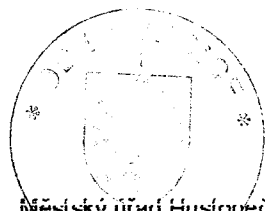
Městský úřad Hustopeče Odbor reg. rozvoje 2010-01-06 10:39:59

Svěšeno dne : 4.1.2010 Razítko, podpis :