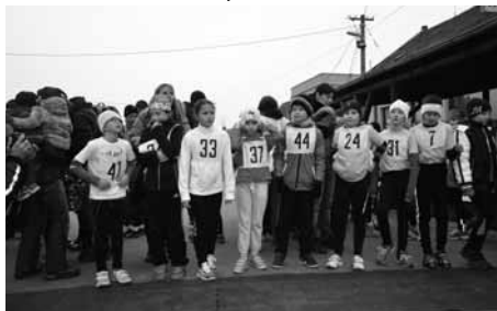
Na start se postavila asi padesátka dětí.

Tradiční běh městem Vánoční desítka se letos nesl ve znamení rekordů. Na start se postavil rekordní počet běžců a do cíle doběhli vítězové v traťových rekordech - a to jak v mužské, tak v ženské kategorii. Šestý ročník vánočního běhu městem se konal na stříbrnou neděli 14. prosince 2014.