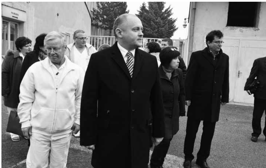
Jednání s krajem pokračují. Na pracovní návštěvu přijel do hustopečské nemocnice i hejtman Michal Hašek.

O tom, v jakém modelu by mohla nemocnice fungovat, rozhodne především ekonomický audit. Má být hotový koncem roku 2014. Již teď je ale zřejmé, že je třeba počítat se změnami. „Ne všechna oddělení, ne všechny provozy jsou životaschopné. Snažíme se, aby proběhl velký ekonomický audit, abychom opravdu dostali čísla, která budou reálná. Předpokládáme, že ambulantní péče v nemocnici zůstane v tom rozsahu, v jakém je, ne-li rozšířená podle požadavků veřejnosti tak, jak si to vyžaduje situace Hustopečska,“ plánuje starostka.