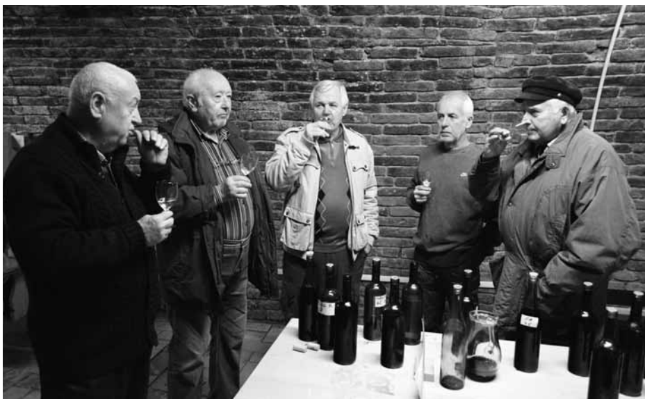
Přehlídka archivních vín se konala tradičně ve sklepě v ulici Na Hradbách.

Přehlídka archivních vín podle něj rozhodně nebude chybět ani v kalendáři akcí na příští rok. „Jeden rok jsme vynechali a doneslo se