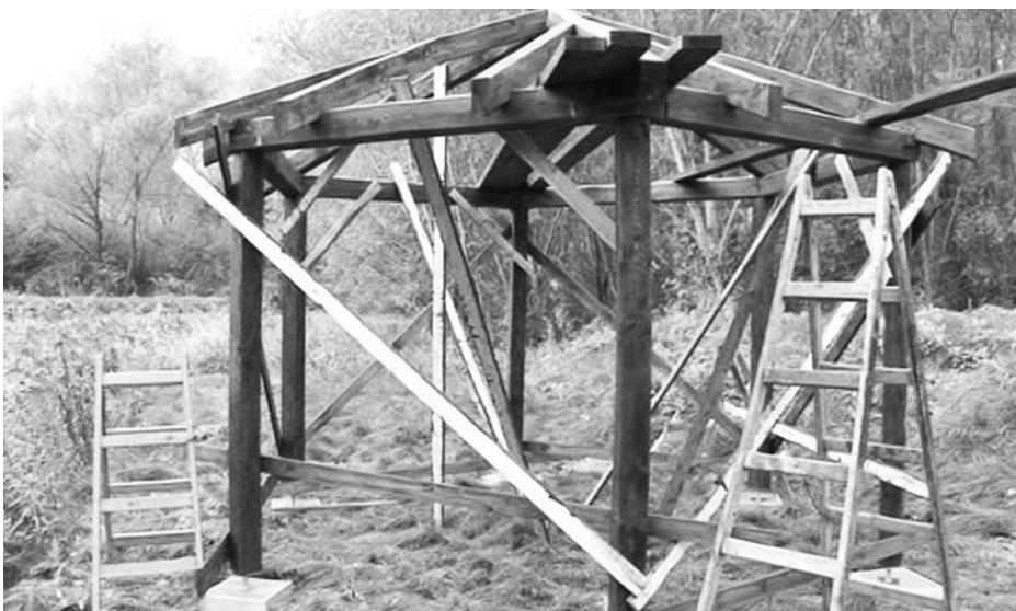
V okolí tůní v nivě Štinkovky vznikly mimo jiné i dva zastřešené altány. Budovaly se v listopadu.