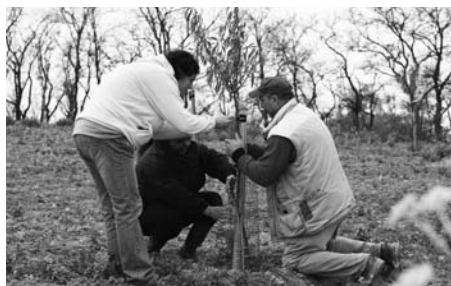
Pletivo by mělo mladé stromky ochránit před hladovou zvěří.