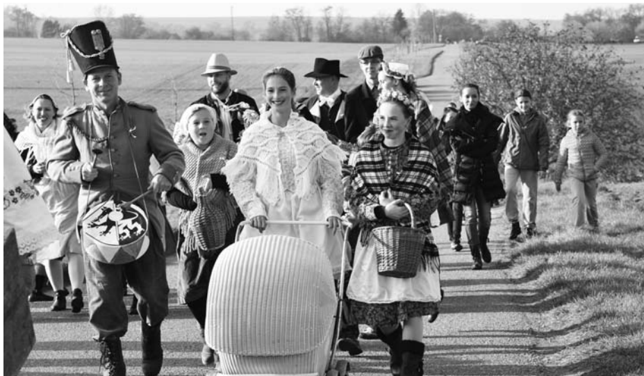
Vesničané přinesli na hranice svatební koláčky i víno.

Před rokem se na celnici mezi Hustopečemi a Starovicemi válčilo. Letos usmířovalo. Měšťáci a vesničané stvrдили spolupráci svatbou i vysazením lip u zrekonstruovaného křížku. Svatbu na bitevním poli odsvědčily desítky draků na obloze.