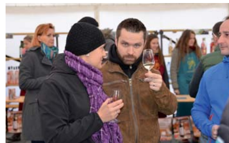
K ochutnání bylo 42 vzorků svatomartinského.

vinařskou expozici města a ochutnat městské víno.