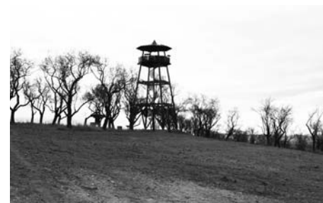
U rozhledny je připraven pozemek na výsadbu nových stromů.