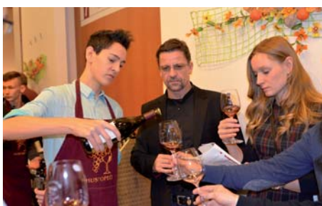
Ochutnat špičková vína mohla široká veřejnost.