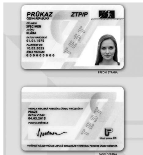
Podoba nového průkazu.