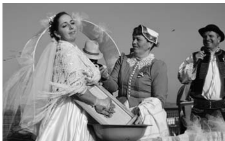
Nevěstu dodalo město, ženicha vesnice. Nevěsta musela prokázat, že je zručná a hodí se i na vesnici.