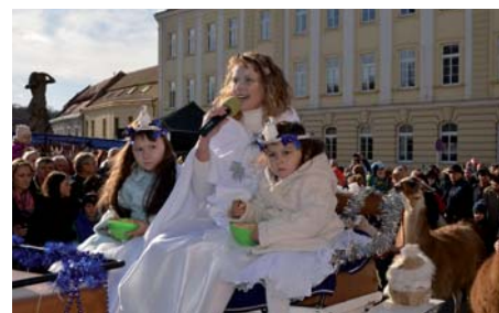
Vlády se ujala Zimní královna s dcerami Sněženkami.

Na své si však přišel i ten, kdo mladému vínu příliš neholduje. Na nádvoří domu U Synků byla k ochutnání vína starších ročníků i svařák. Bylo možné navštívit i Stálou