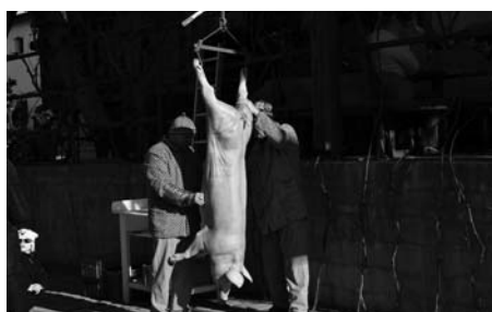
K vidění bylo na Turhandlích i umění řezníků.

Stovky návštěvníků však na Turhandle nelákaly jen masky, ale také krásné slunečné počasí a zabíjačkové dobroty. Ochutnat bylo možné tlačenko, jitrnice, jelita a k vidění bylo