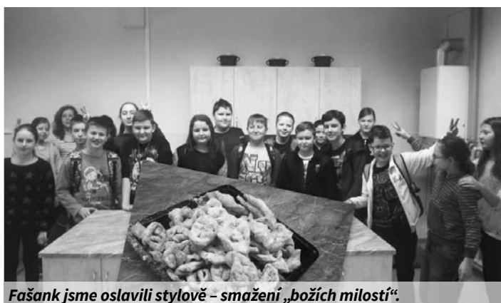
Fašank jsme oslavili stylově – smažení „božích milostí“.