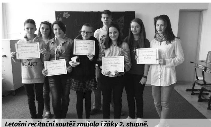
Letošní recitační soutěž zaujala i žáky 2. stupně.