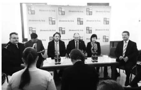
Po zasedání rady se konala tisková konference pro novináře.