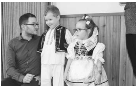
Dětský krojový ples se konal popáté.