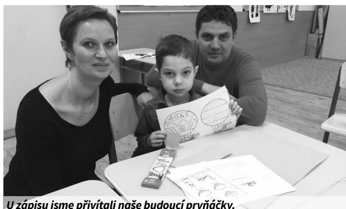
U zápisu jsme přivítali naše budoucí prvňáčky.