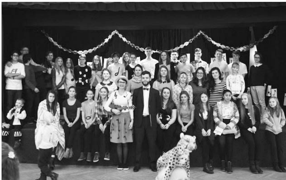
Dětský karneval. Téma: Písničky a muzikanti.