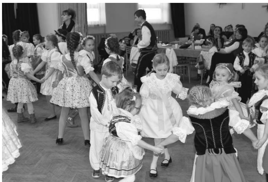
Sál zaplnili malí krojovaní. Z hustopečského folklórního kroužku jich bylo pětadvacet.