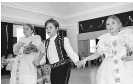
Děti si nacvičily Slováckou besedu.

Fotogalerie na www.rajce.net , uživatel Hulisty, -jal-