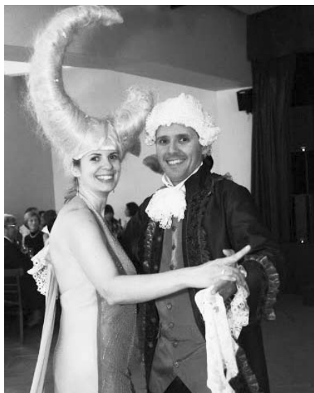
Děkánský ples se letos nesl v zámeckém duchu.

Nedávno se mě kdosi ptal, co přivedlo farnost k tomu, aby pořádala plesy, karnevaly a jiné akce, které nemají s kostelem nic společného. Matně si vzpomínám, že jsem v odpovědi použil své oblíbené rčení. Všechno nadpřirozené, předpokládá přirozené. Protože není nic horšího než člověk, který není plně přirozeně člověkem a přitom se chová svatě. Každopádně