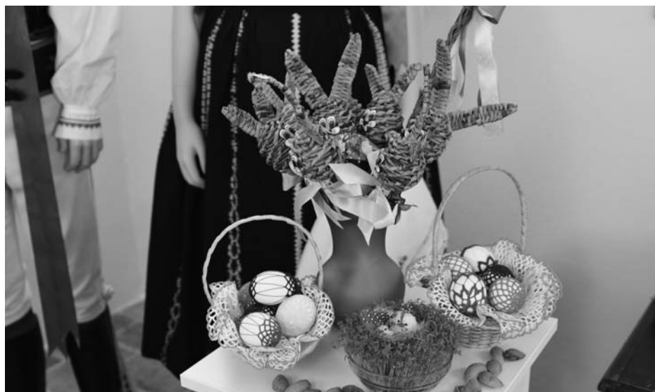
Velikonoční prodejní bazar s výstavou jarních aranžmá 2015.