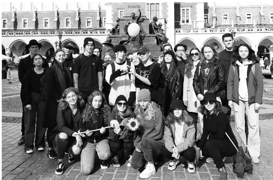
Vyrazili jsme do Polska.

Během pobytu v Krakově také navštívili Wieliczku, památku UNESCO, kde s nadšením prozkoumávali kouty zdejších rozlehlých solných dolů. Další den výprava směřovala po krakovských památkách UNESCO, mezi něž patří např. Hlavní náměstí s radniční věží, tržnicí Sukiennice a Mariánským kostelem, z jehož vyšší věže každou hodinu troubí hejnal slavnou melodii. Také výzdoba kostela