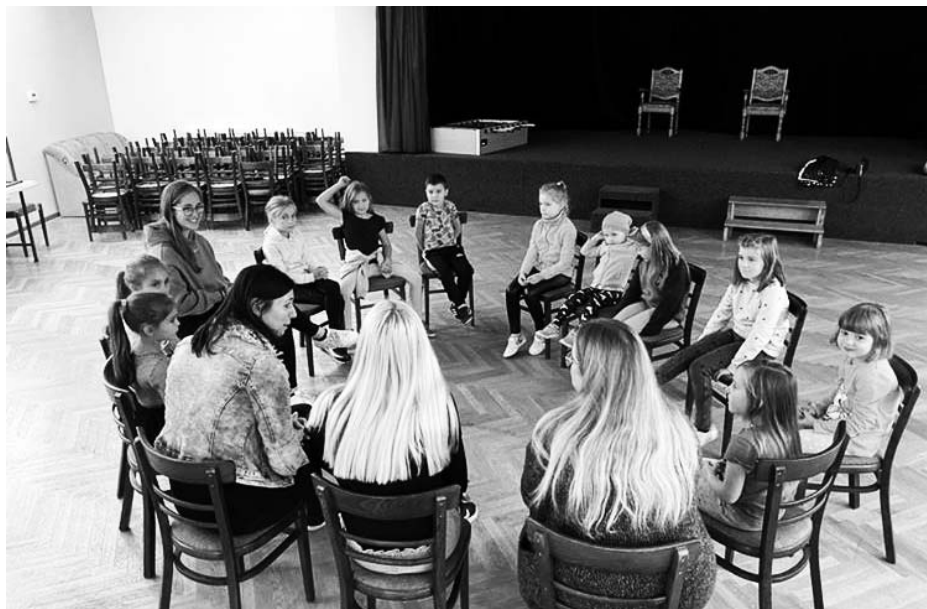
Krajcárek pěstuje lásku k tradicím.

Krajcárek se schází k nacvičování každý pátek od 16.30 do 17.30 hodin a přidat se