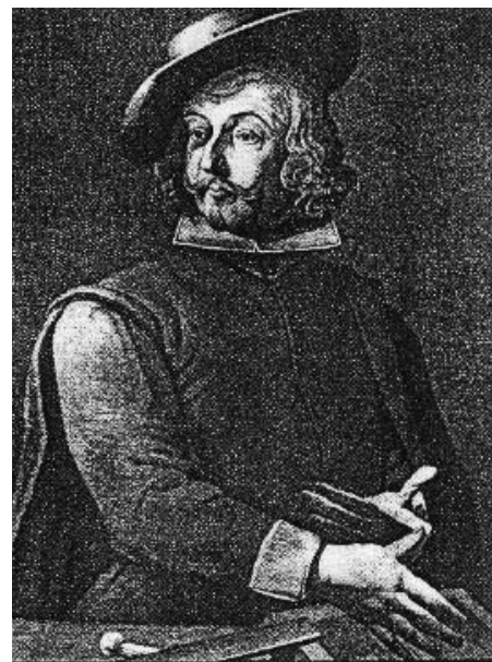
Jakob Hutter, nejvýznamnější představitel tyrolských a moravských novokřtěnců.

podáváme žádost o finanční příspěvek v rámci Fondu malých projektů, programu Interreg.