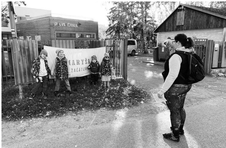
Do Divák putovaly i ti nejmladší z nás.

Na samotný pochod se letos vydalo několik desítek pěších, mezi nimiž nechyběli ani ti