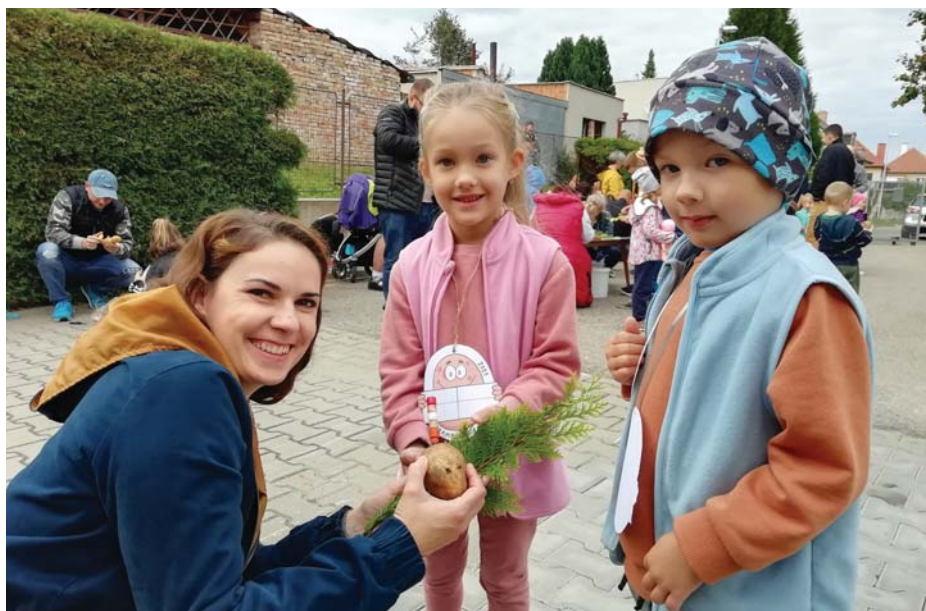
V Pastelce jsme se věnovali bramborám!