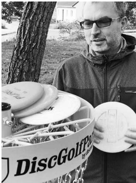
Křížový vrch má další lákadlo.

konce října přibudou ještě grafické infotabulky, mapa hřiště a samotné disky na házení. „Ke hře se používají speciální disky pro discgolf, je jich několik druhů. Není vhodné používat frisbee,“ dodává Fojtlík.