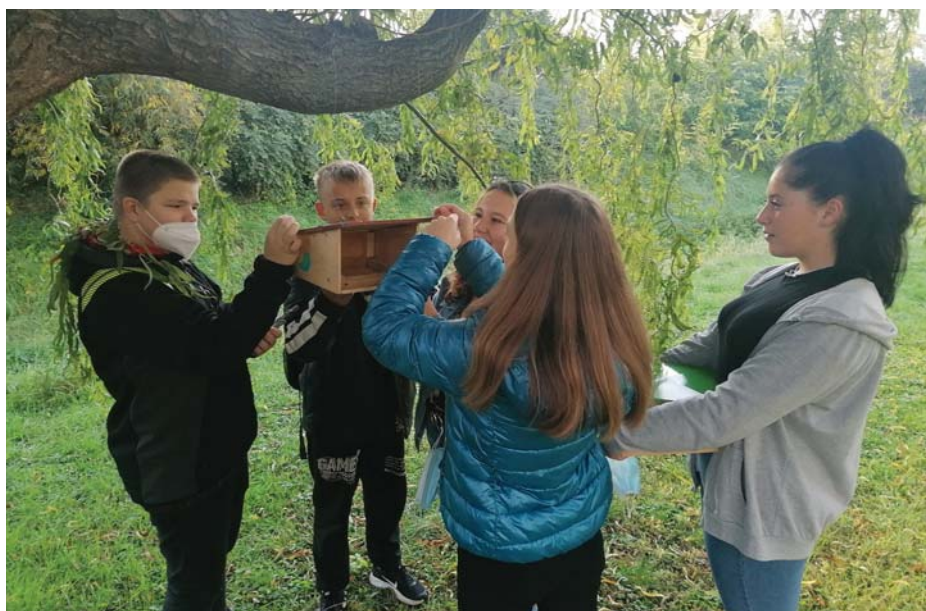
Osmáci navěsili na Penzionu budky pro ptáčky.

V hodinách češtiny si žáci druhého stupně zahráli po celé škole bojovou hru Actionbound. Úkoly byly vědomostní, akční i kreativní. Žáci luštili přesmyčky, rozpoznávali přísloví podle obrázků, hledali místa podle popisu, natáčeli scénky... V hodinách výtvarné výchovy kreslili pomocí kódů barev obrázky zvířat z celého