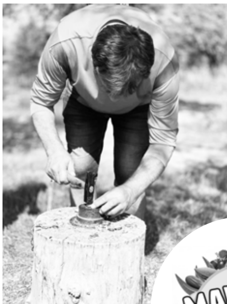
Soutěžilo se v rozbíjení mandlí.