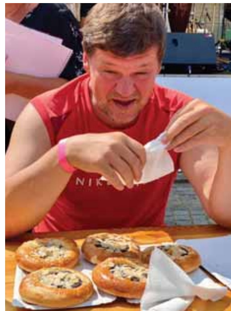
Proběhla soutěž jedlíků.

s mandlemi. V první řadě to byla místní hustopečská Formanka s vynikajícími krevetami a kachnou, dále vegetariánská Bájomlska se svými quesadillas, restaurant Tukan z Brna s mandlovými hotdogy a borci z U Dřeváka z Brna a jejich monster hamburgery. Vše jsme ochutnaly a vše bylo vynikající!