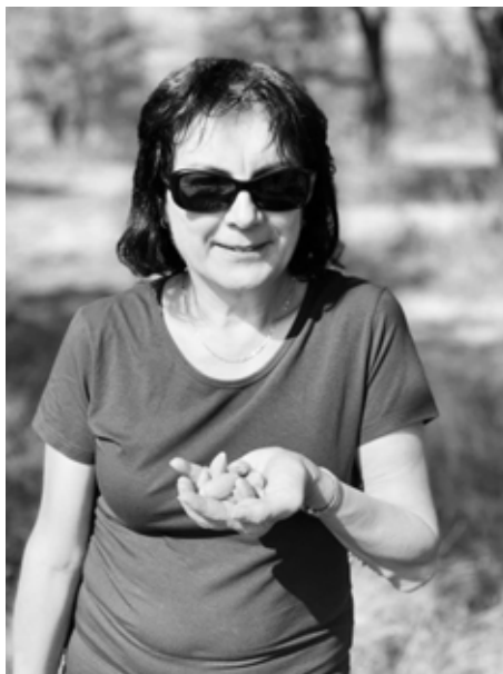
Akce se točila kolem mandlí.

Velkou poklonu skládáme týmům restaurací, které k nám přijely a po celý den vařily mandlová menu. Šly do toho rizika, a přestože se sami potýkají s personálními či ekonomickými potížemi, popustily uzdu kreativitě a my jsme tak mohli ochutnat pokrmy z mandlí či