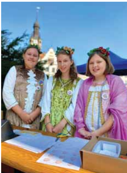
U mandlových víl se vyráběly buttony.