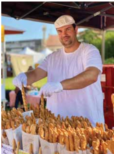
Na návštěvníky čekaly stánky s bohatou nabídkou.