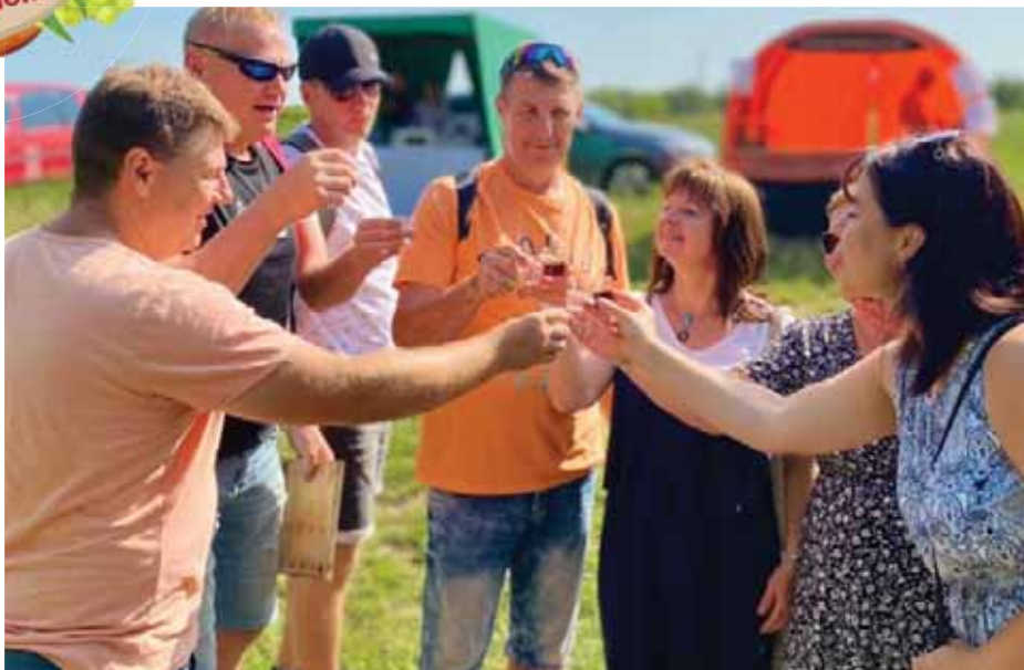
Děkujeme všem, kteří dorazili.