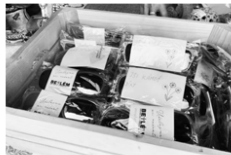
Výtěžek z prodeje brýlí udělá Radost.

Podářilo se nám sehnat nádherné zboží do řemeslného jarmarku, rodiny s dětmi si hrály v parku u kostela nebo tvořily s mandlovými vílami. Kapely Ukulele orchestra jako Brno, Z horní dolní a dál na jih, La Bande a Buty rozproudily diváky k tanci pod pódiem. Popíjelo se a hlavně jedlo.