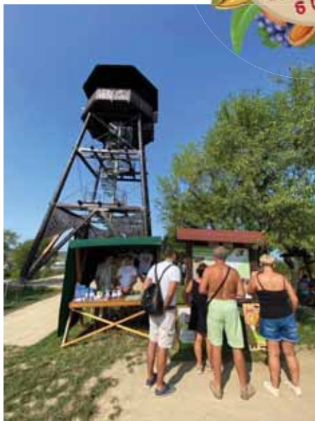
Pod rozhlednou bylo živo.

Článek byl zveřejněn 23. 8. 2021 na webu města.