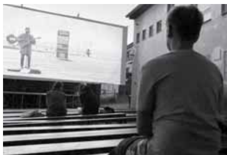
Letní kino v Hustopečích je stálíci kulturního programu.

V letošním roce se promítalo pět filmů během jednoho týdne a každý večer dorazilo průměrně 20 diváků. „Promítali jsme Yesterday, Rande naslepo, Bábovky, Princeznu zakle-