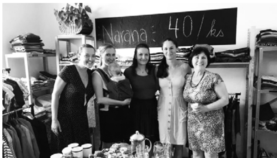
Narana slavnostně otevřela.

Po několikátýdenních přípravách se v pondělí 19. července obchůdek otevřel pro veřejnost a na návštěvníky čekaly regály plné zboží od dětského oblečení a knih po vybavení domácnosti. Na své by si tak mohl přijít každý milovník hledání pokladů. Kdy mohou návštěvníci obchůdku dorazit? „Přes léto zatím budeme fungovat od úterý do čtvrtka od 10 do 17 hodin, i během této otevírací doby mohou lidé nosit své věci, protože jich zatím nemá-