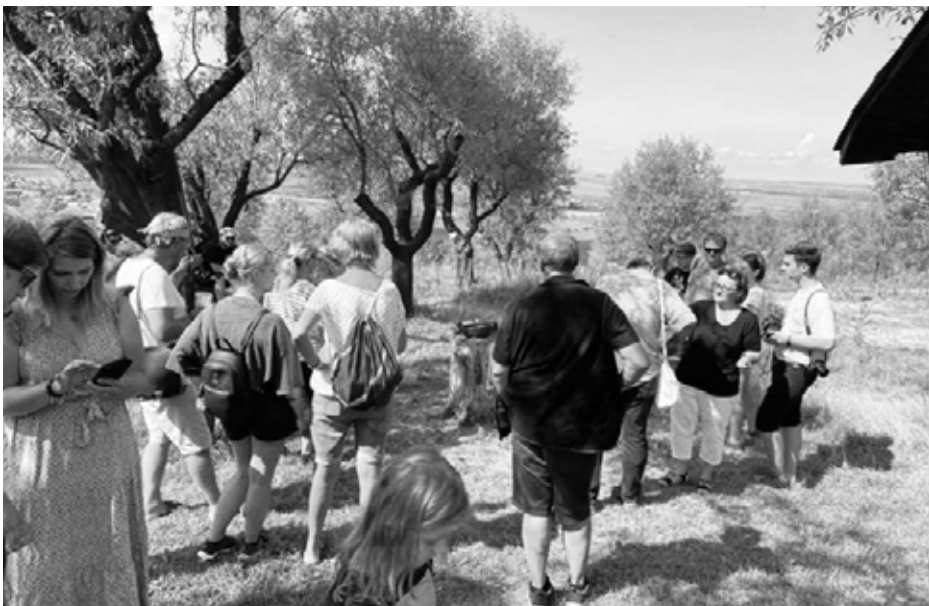
I v sadu čekal na návštěvníky bohatý program.