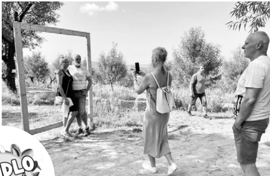
Vyfotili jsme se u nového fotorámu.