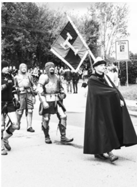
Poslední Burčákové slavnosti se konaly v říjnu 2019.

Náměstí ovládne středověký jarmark, dobové hudby, cimbálové muziky, rytířská klání či ohňová show. Program myslí i na vyznavače modernější hudby. Na hlavním pódiu vystoupí Lucie Bílá a kapela Arakain, Michal Hruza či Pokáč.