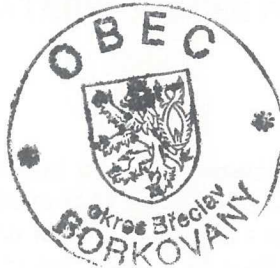
Kulaté razítko Obec