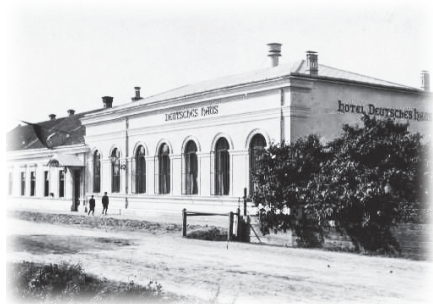
Budova bývalé Ludvíkovy tiskárny na pohlednici z 20. let 20. století.