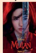
Legenda o Mulan

MĚSTSKÉ MUZEUM A GALERIE , dům U Synků, Dukelské nám. 23, www.muzeumhustopece.cz