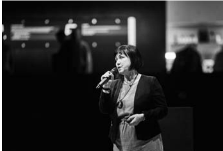
Hustopeče reprezentovala starostka města.

Konference se konala ve čtvrtek 6. února