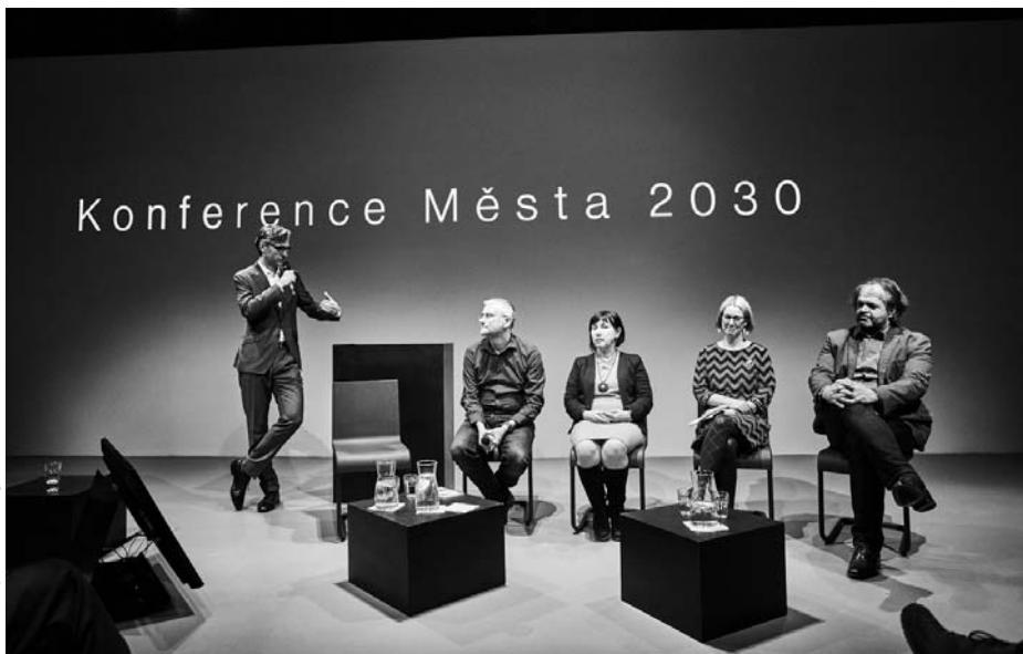
Konferenci navštívili zástupci větších i menších měst.