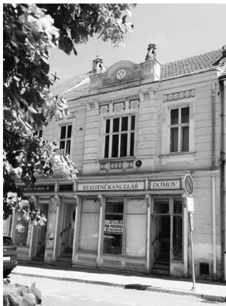
Dům Nohelové čeká rekonstrukce.

čeká do budoucna rekonstrukce. Objekt se tak momentálně nachází ve stavu odpovídajícímu stáří a provedeným stavebním úpravám a opravám. „V současnosti tento dům temperujeme a vytápíme, aby dále nechátral. V blízké budoucnosti se bude vyklízet, v plánu je oprava střechy a uvedení fasády do původního stavu. Momentálně mají využití pouze prostory garáže za domem, ty město prona-