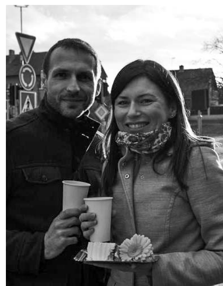
Snažení manželů bylo sladce oceněno.

Článek byl zveřejněn 17. 2. 2020 na webu města.