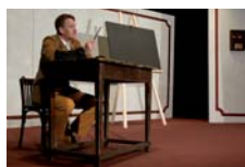
Představení v rámci regionální přehlídky venkovských divadelních souborů MRŠTÍKOVO DIVADELNÍ JARO 2020