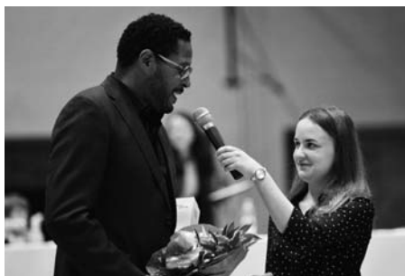
Hlavním hostem závodů byl Javier Sotomayor.

Díky strhujícímu souboji juniorů se další program Hustopečského skákání o hodinu