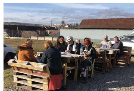
...a přátelských chvil.

Organizátoři akce M.S.QUATRO a Hotel Rustikal