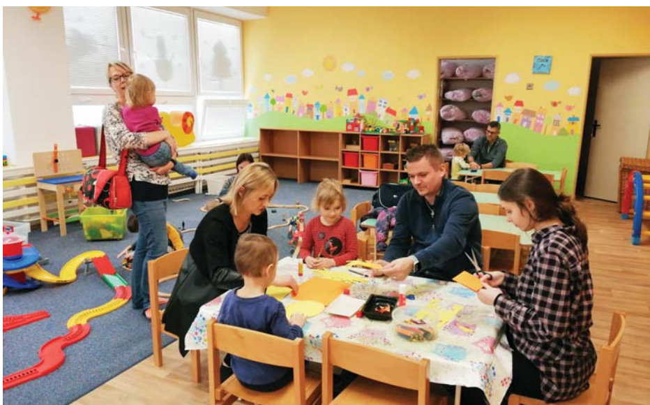
Rodiče se alespoň na chvíli vrátili do dětských let.