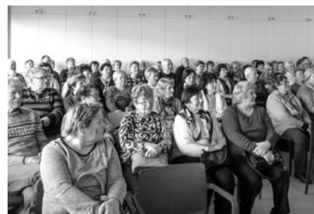
Členská základna přesáhla počet 200 osob.