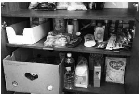
Pomoc zamíří např. pro maminky samoživitelky, seniory a nemocné.