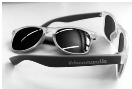
Výtěžek z prodeje poputuje na dobročinnost.

Na návrh Dopravní komise města bude upraven dopravní režim ve spodní části Dukelského náměstí naproti gymnázia. Nově budou místa opatřena dopravním značením umožňujícím vozidlům pouze krátkodobé parkování po dobu max. 15 minut (je např. i v horní části náměstí), a to v pracovní dny v době od 7:00 do 17:00. „Město dlouhodobě řeší parko-