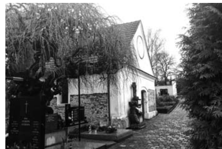
Kaple na hřbitově.

Článek byl zveřejněn 5. 2. 2020 na webu města.