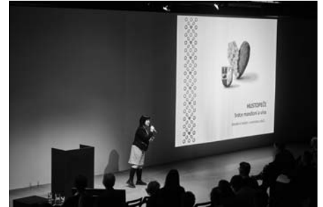
Starostka představila současný i budoucí Hustopeč.