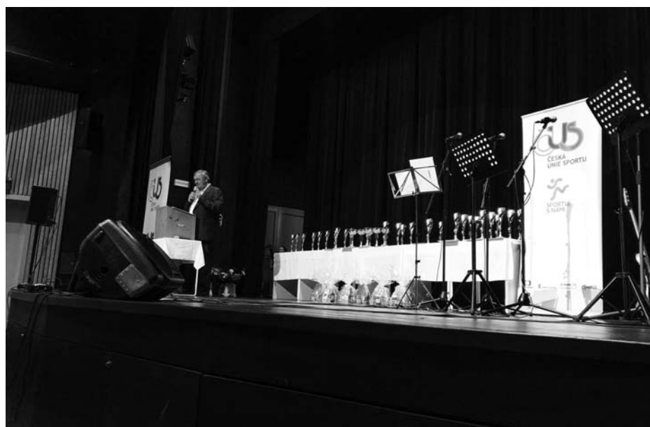
Hustopečské kino hostilo Sportovce okresu.