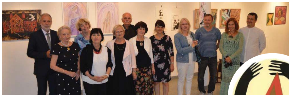
Zahájení výstavy se zúčastnili čelní představitelé obou měst i muzeí.