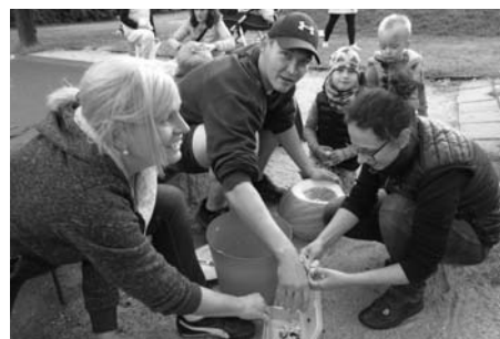
Při Veselém dýňování rodiče s dětmi vyráběli, z brambor a třeba i z řepy krásné strašáky dýňáčky.

se neslo v duchu dobré nálady. Za odměnu si všichni pochutnali na dobrotách, které připravily paní kuchařky a děti ve svých třídách.