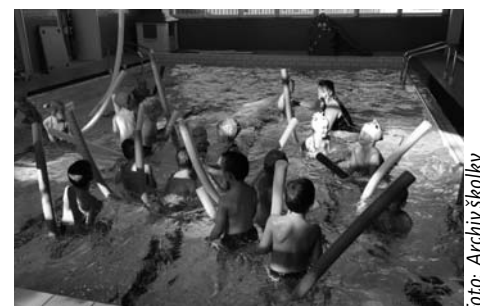
Předškolákům v září začal plavecký kurz.