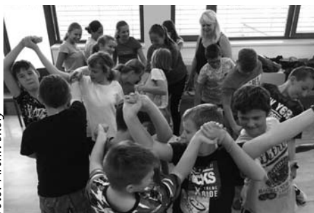
Kolektiv šestých tříd se vzájemně se seznamovaly na adaptačních dnech.

Září bývá vždy zpočátku trochu rozpačité. Po letních prázdninách se (kromě natěšených prvňáčků) jen málokomu chce zpět školních lavic, zvláště když nastupujete do úplně nové-