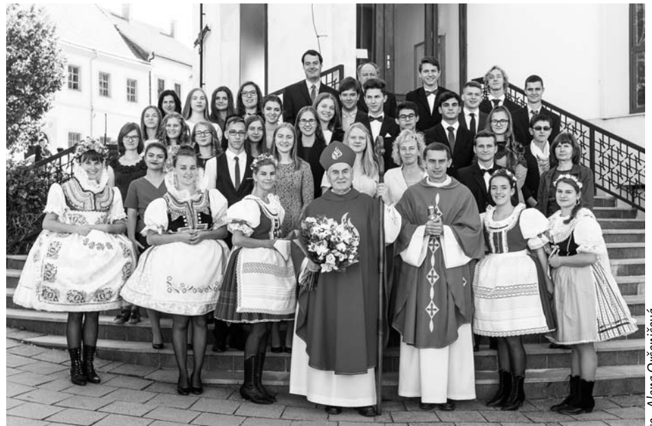
Při slavnostní výroční mši svaté přijalo 36 farníků svátost biřmování.

Patronem hustopečského kostela je svatý Václav, jehož ostatky jsou uloženy v oltáři a viditelně ho připomíná také svatováclavská koruna na věži. Svého patrona si volili i biřmovanci. „U nás je zvykem, že si vybírají svého patrona, někoho, kdo je oslovuje svým životem nebo něčím, co udělal. Volí si obvykle jedno a někdy i dvě jména,“ řekl biskup. Dva patrony má také hustopečský kostel, jsou inspirací i mladým farníkům. Několik z nich