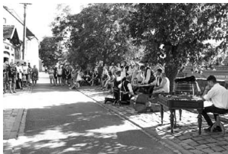
Letos poprvé bylo součástí zarážení hory i otevření sklepů v obou vinařských uličkách.