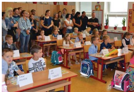
Na každé základní škole v Hustopečích letos otevřeli dvě první třídy.