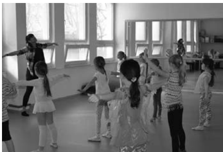
Výuka tanečního oboru ZUŠ probíhá v novém tanečním sále.

Právě v nových prostorách tanečních a výtvarných oborů v budově Základní praktické školy Hustopeče se ve středu 4. září konal Den otevřených dveří. „Děti i s rodiči mohou nahlédnout do našich nových prostor a uvidí, jak bude výuka probíhat. Máme ji rozdělenou do několika kurzů, pro mladší tanečnický od pěti do osmi let, a pro ty starší od devíti