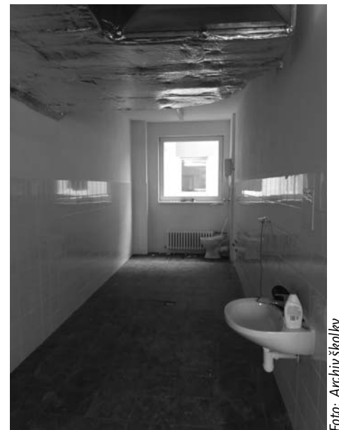
Díky přičinění mnoha lidí je rekonstrukce MŠ Pastelka u konce.