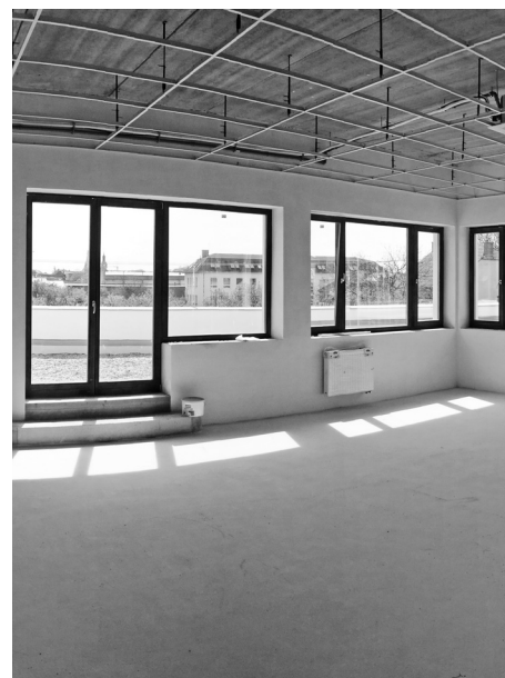
Radní schválili veřejnou zakázku na vybavení interiéru nové budovy Pavučiny.

Strategická poloha mezi Brnem a Břeclaví u sjezdu z D2 předurčuje naše město k vybavení místem, kde si mohou řidiči dobít auta na elektrický pohon. Ta jsou v dnešní době stále rozšířenější a úskalí vyšší pořizovací ceny kompenzují nižší náklady na provoz a údržbu i ohleduplnost k životnímu prostředí. Po zvážení několika variant umístění se radní rozhodli pro ulici Husovu (naproti poště). Stanice zabere dvě parkovací místa, která ovšem zůstanou řidičům k dispozici na omezený čas v době, kdy nebude zájem o dobíjení. Využít je budou moci zákazníci pošty i obchodů a o této alternativě bude informovat dodatková tabule. Vedení města připravuje podmínky pro zadání objednávky projektové dokumentace a prověřuje variantu realizace na náklady města. Druhým řešením je vybudování nabíjecí stanice v režii externí firmy, s čímž jsou ale spojená určitá omezení týkající se například zajištění suverenity v lokalitě.