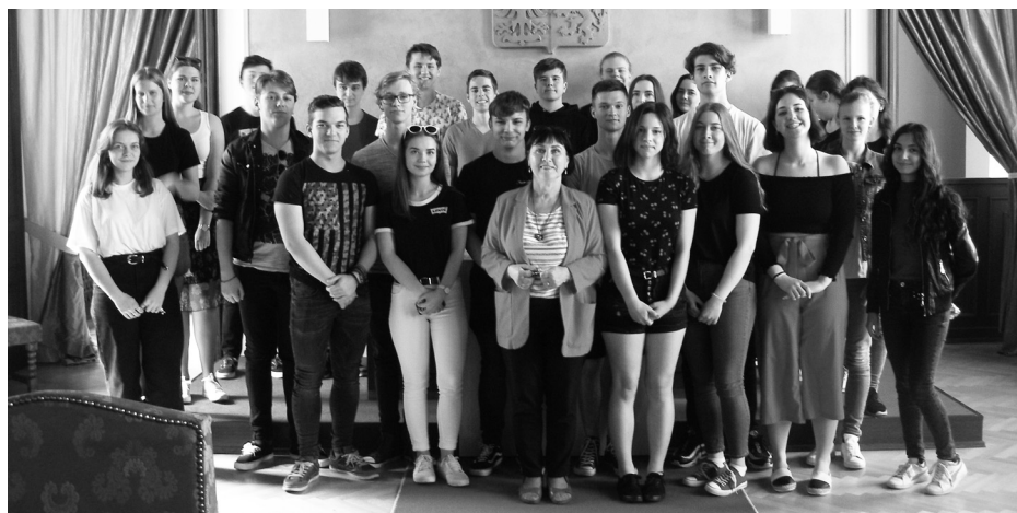
Žáci 2.A navštívili radnici a s paní starostkou pobesedovali o fungování samosprávy.