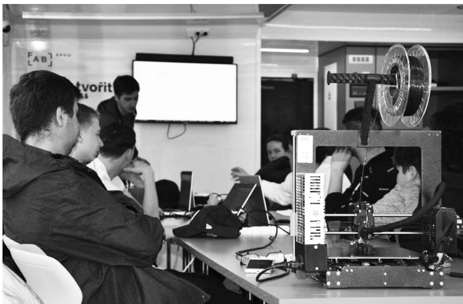
Projekt pojízdné výrobní laboratoře umožňuje žákům setkat se s nadstandardním vybavením, které běžně nemají k dispozici.

Výstavba mobilního FabLabu vyšla na osm milionů korun a projekt finančně podpořil Jihomoravský kraj, město Brno a řada firemních sponzorů. „Jižní Morava je region silný ve strojírenství, IT i technických oborech. Máme mnoho šikovných a vynalézavých lidí s vlastním nápadem, kteří ne vždy mají potřebné