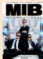
Muži v černém 3