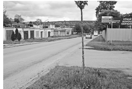
Podél garáží směrem k finančnímu úřadu vznikne nový chodník.

Firma opraví dvorní fasádu a nainstaluje venkovní žaluzie kvůli ochraně proti světlu i teplotě. Radní na své třinácté schůzi schválili