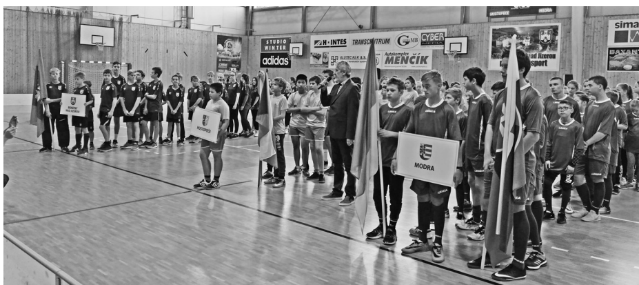
Hustopeče budou letos hostit sportovní turnaj žáků základních škol.

Hustopeče budou letos hostit sportovní turnaj žáků základních škol. 19. a 20. září přijede z každého partnerského města 32 dětí s pedagogickým doprovodem. Kromě zápa-