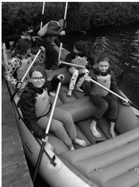
Na škole v přírodě čtvrtáci jezdili i na raftech.

Sportovní aktivity se dají spojit i se školou v přírodě. Žáci 4.B a 4.C si zajeli na sportovní pobytu do Outdoor resortu Březová. Všechny tři dny byly plné aktivit, které děti využily a vyzkoušely vše, co mohly. Hned první den jezdily na raftech, prolézaly venkovní hřiště se skluzavkami a různými překážkami a vyřadily se na obří vzduchové trampolíně. Druhý den začal zdoláváním lezecké stěny, bongem