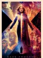
X-Men: Dark Phoenix

CVČ PAVUČINA , Šafaříkova 40, mobil: 774 095 524