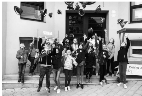
Projekt Abeceda peněz byl zakončen úspěšným jarmarkem

Jarmark s prodáváním výrobků byl vyvrcholením několikaměsíční akce. Děti nejprve vyrazily na exkurzi do banky, aby se seznámily s jejím fungováním a koloběhem peněz. Dostaly také užitečné rady do startu svého podnikání. Potom bylo jejich úkolem vybudovat vlastní firmu. Musely vymyslet svůj podnikatelský záměr, dojít s ním do Spořitelny, představit ho, obhájit a požádat o poskytnutí úvěru. Na základě podpisu úvěrové smlouvy dostaly úvěr ve výši tří tisíc korun na rozjezd podniku, na pořízení materiálu.