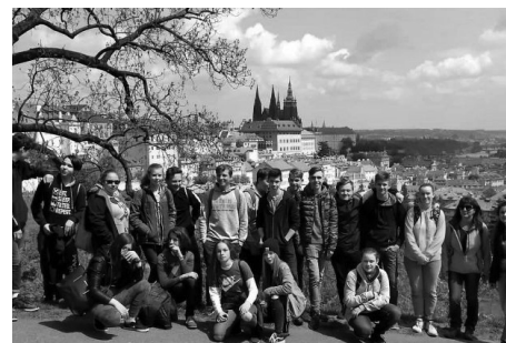
Osmáci a devátáci během návštěvy Prahy zavítali i na Petřín.

V polovině května se konalo krajské kolo ve vybíjené. Nejprve bojovala děvčata. Bohužel se musely spokojit se šestým místem. Na kluky čekalo 7 vyrovnaných týmů. Skončili na pátém místě. Všem patří poděkování za skvě-