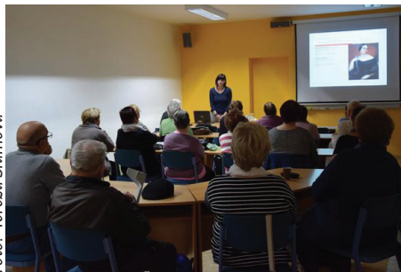
Zájem o osudu známých spisovatelek přilákal do knihovny mnoho posluchačů.

Osudové ženy se tak staly třešničkou na dortu přednáškové sezóny v knihovně. Tu