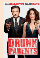
Rodiče na tahu