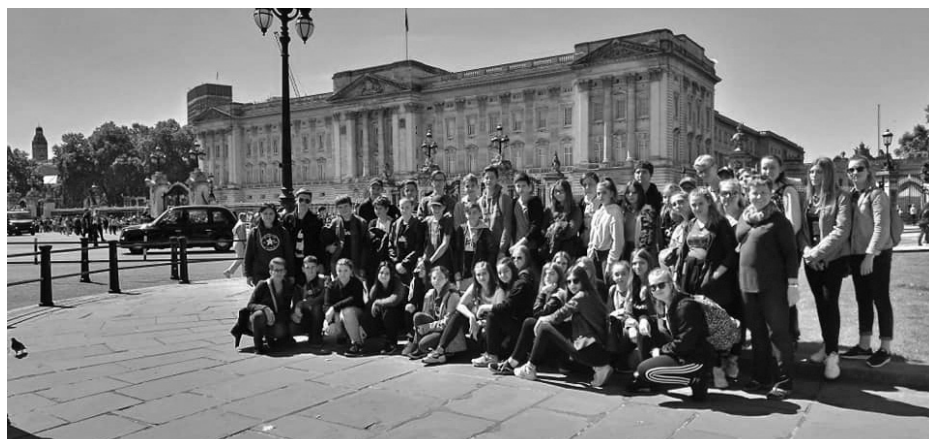
Během týdenního pobytu si žáci prohlédli i historické centrum Londýna