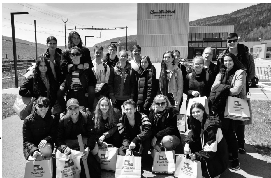
Ve Švýcarsku studenti navštívili i čokoládovnu.