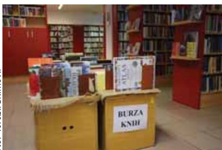
V dubnu v knihovně probíhala burza knih.

Článek byl zveřejněn na webu města 5. 4. 2019.