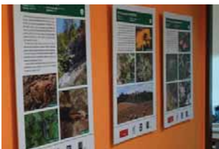
Na přehledných panelech výstavy byly jednotlivé chráněné lokality Brna důkladně popsány.