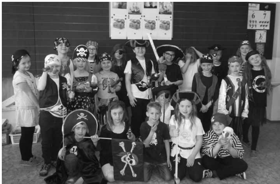
Do 1. A zavítali piráti, třída se proměnila v několik posádek a plnila povely chrabrého kapitána.