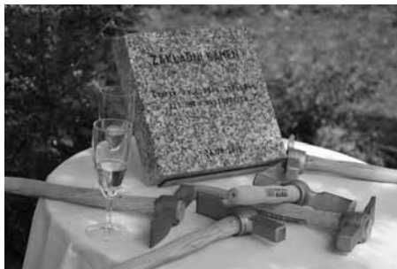
Základní kámen nové výjezdové základny záchranky v Hustopečích slavnostně poklepali zástupci Jihomoravského kraje, záchranky i dodavatele stavby.

Ta bude dvoupodlažní, nepodsklepená s plochou střechou a s převýšenou částí hlavního schodiště a technického zázemí. „Přáli jsme si, aby návrh provozně dispozičního uspořádání základny kladl důraz na vytvoření krátkých přehledných vazeb mezi bytovými prostory záchranářů a pohotovostními stánky sanitních vozů. Pro rychlý přesun posádek k sanitkám bude sloužit optimálně umístě-