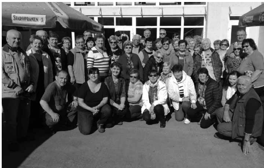
V lázních Piešťany si týdenní pobyt užilo 65 účastníků.