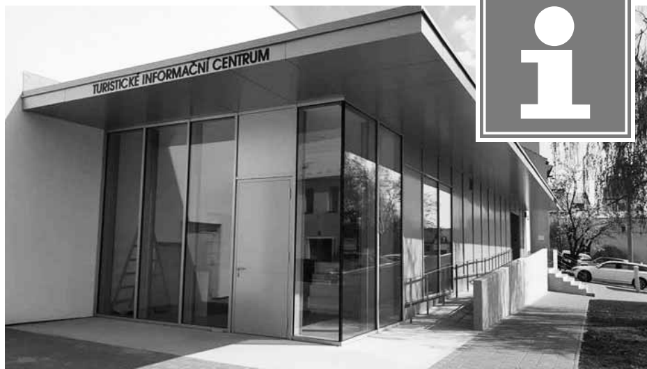
Turistické informační centrum najdete na nové adrese.

Článek zveřejněn na webu města 18. 4. 2019.