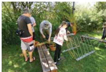
Do pletení pomlázek se zapojily i dívky.