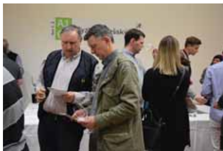
Návštěvníci mohli ochutnat přes 300 vzorků vín.

Článek byl zveřejněn na webu města 8. 4. 2019.