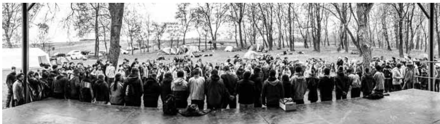
Křížový vrch patřil o víkendu skautům, závodu se zúčastnilo přibližně 230 dětí a 80 vedoucích.