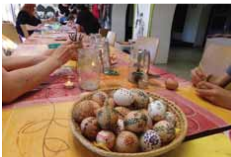
Zdobily se kraslice.