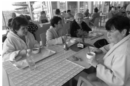
Po koupeli nechybělo občerstvení a nezbytná kávačka.