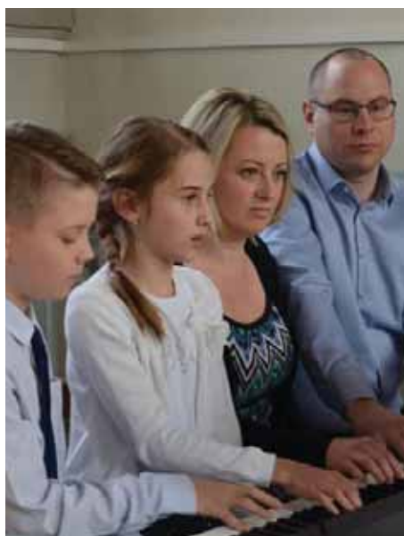
Rodina Slaných zahrála osmíručně na klavír.

Článek byl zveřejněn na webu města 3. 4. 2019.