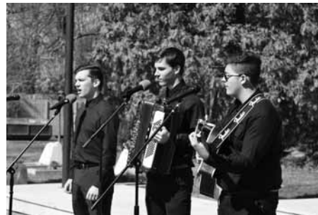
Studenti Gymnázia T.G. Masaryka zazpívali za doprovodu harmoniky a kytary dvě kozácké písně.