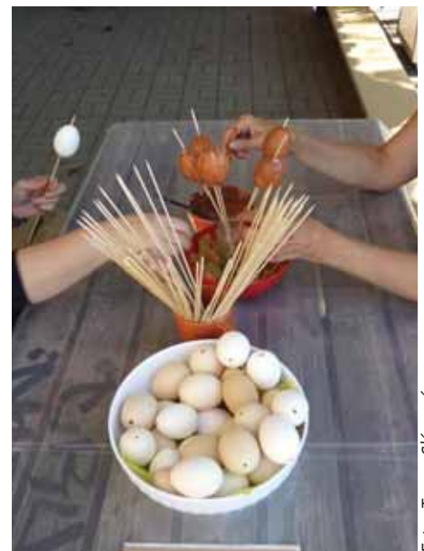
Vejce se zdobila i prastarou technikou, obarvila se blátem, do kterého se po zaschnutí vyrývaly různé ornamenty.