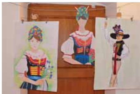
Jedním z tematických celků byly kroje Hustopečska.

Článek byl zveřejněn na webu města 2. 4. 2019.