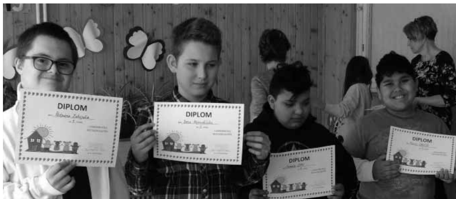
Naše škola si odvážela krásná první místa ve všech třech kategoriích.