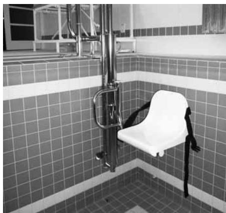
Nový bazénový zvedák pomůže hendikepovaným na letním koupališti i krytém bazénu.

V blízkosti pokladny vzniknou i nová stání pro kola, odpovídající současným parametrům. Hlavní novinkou ale bude bazénový zvedák. Zařízení s názvem Delfín bude sloužit nejen vozíčkářům, ale také všem, kteří jsou hůře pohybliví například kvůli vyššímu věku nebo váze. „Zajímavostí toho zařízení od