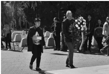
Vzpomínková akce byla zakončena položením věnců.