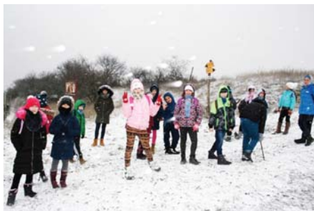
Sněhová přeháňka na rozhledně.

V týdnu od 11. do 15. února měly děti školou povinné jarní prázdniny. Pavučina pořádala