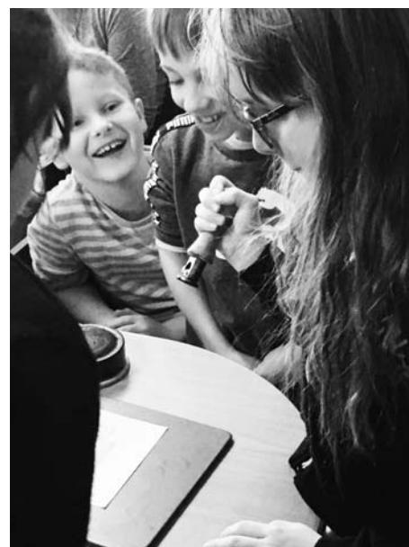
Třetáci navštívili poštu a užili si razítkování.