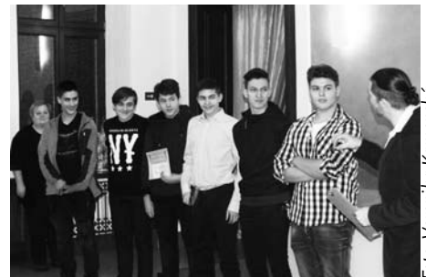
Házenkáři z klubu Legata

ty. V obou případech zvítězili házenkáři z klubu Legata : muži a starší žáci. Podařilo se jim tak obhájit prvenství z loňského ročníku. „Je pravda, že je těžké zvítězit, ale ještě těžší obhájit. Jsme velice rádi, že jsme obhájili tato dvě prvenství, konkurence byla vysoká. Porota rozhodla a my děkujeme, že tímto způsobem