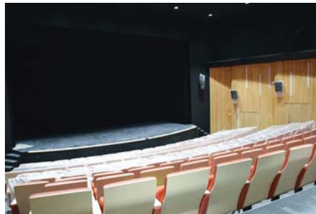
Slavnostnímu otevření Kina bude patřit poslední březnový víkend