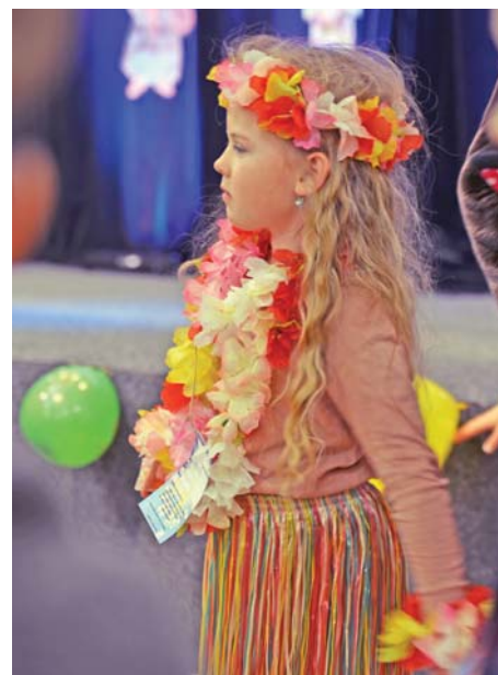
Do rytmu se vlnily dívky z Havaje.