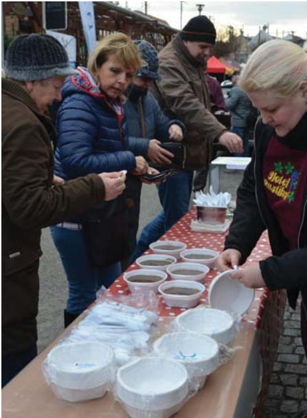
Na masopustu nesměla chybět zabíjačková polévka.

Článek byl zveřejněn na webu města 5. 2. 2019.