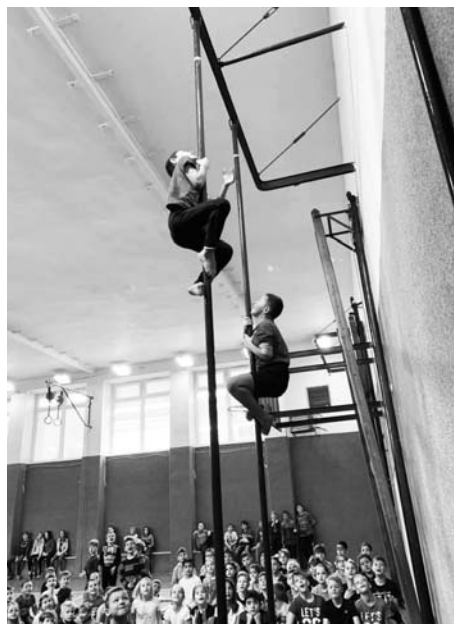
Žáci prvního stupně soutěžili ve šplhu.

· Pololetní vysvědčení jsme oslavili spor-