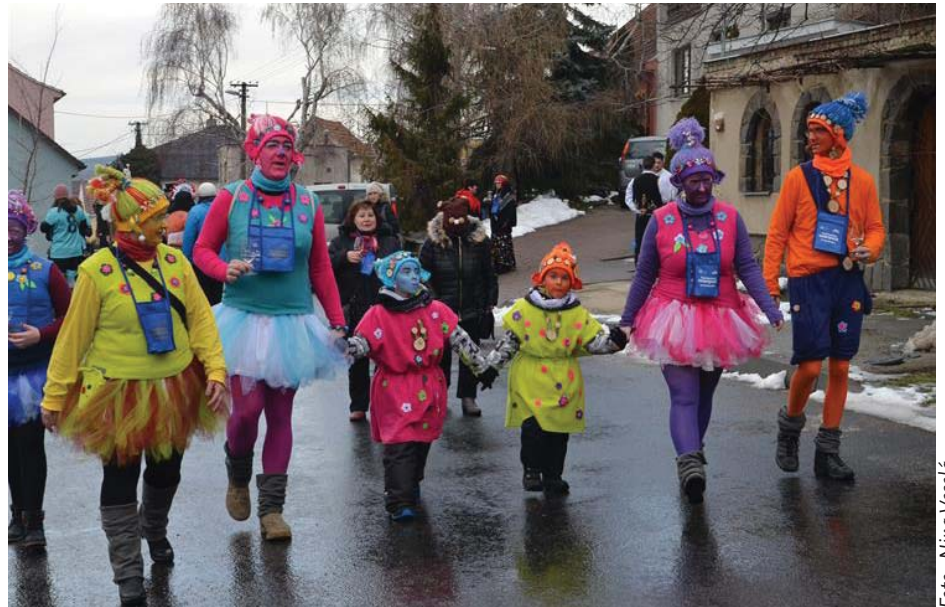
Návštěvníci v kostýmech se proměnili v jiné bytosti.