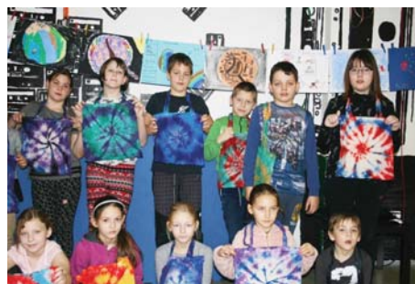
Vlastnoručně batikované vesmírné tašky.

V úterý nás létající koberec přenesl na Slovensko, zdolali jsme nejvyšší hustopečský vrchol, rozhlednu v mandloňových sadech. Při