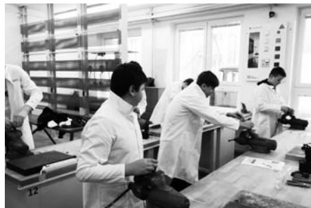
Žáci v dílnách učiliště vyráběli hlavolamy a řehtačky.

· Pro žáky posledních ročníků byl připravený program o kyberšikaně a nebezpečí zveřejňování citlivých informací na internetu. Žáci se do programu aktivně zapojili a jistě si odnesli poznatky, které se jim budou ve virtuálním světě hodit.