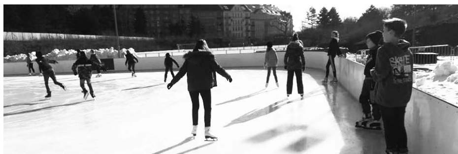
Pololetní vysvědčení žáci oslavili bruslením.

· Před jarními prázdninami byl pro žáky sedmé a páté třídy uspořádán robotický workshop zaměřený především na kódování a práci s tzv. ozoboty. Rovněž jsme se blíže seznámili s využitím dronů a vyzkoušeli si jejich ovládání.