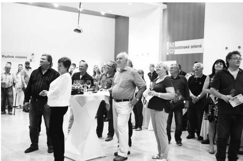
Na přehlídce se setkávají vinaři a milovníci vína.