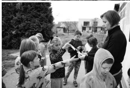
Děti čekaly dva dny plné zábavy.