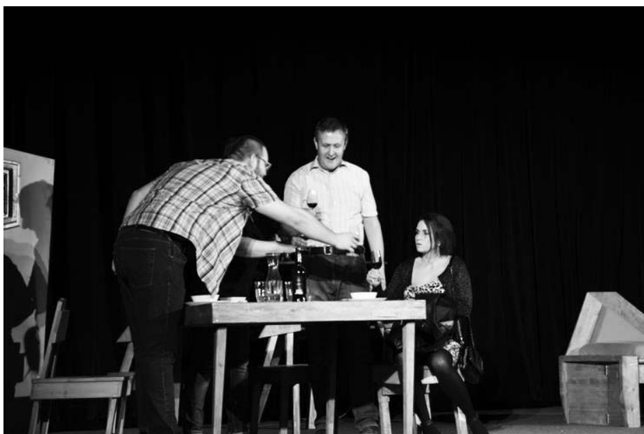
Čtyři představení nabídla čtyři různé světy.

Článek zveřejněn 6. 11. 2018 na webu města