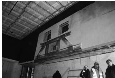
Promítárna bude vybavena nejmodernějšími digitálními technologiemi.

Rekonstrukce odstartovala loni na podzim a bude stát okolo 50 milionů korun. Prvním impulsem k opravě byl chybějící prostor pro