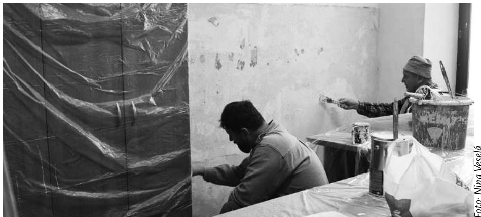
Výmalba radnice se dělá po osmi letech.

Po novém roce se bude malovat i budova tzv. staré pošty, ve které sídlí větší část městského úřadu. Radnice se maluje za běžného provozu, což zde nepředstavuje takový problém, protože nejvíc klientů míří na odbor dopravy a správní odbor, které sídlí ve druhé budově. „Předpokládám, že firma bude pracovat především mimo úřední dny a kanceláře budou rychle připraveny k běžnému provozu,“ uvedl Michalica.