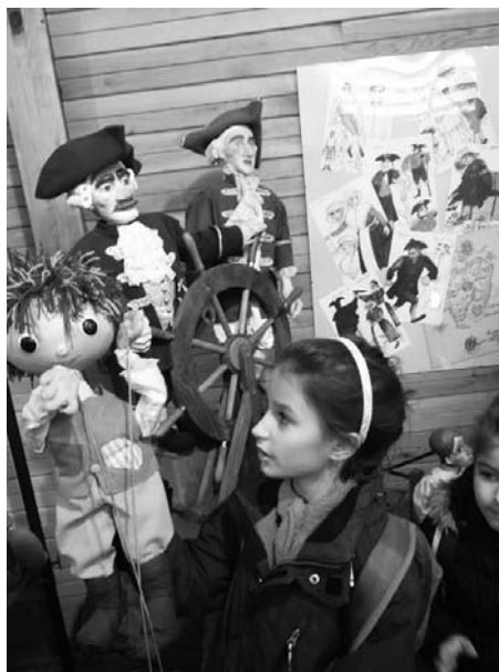
Návštěva třetáků v muzeu loutek Divadla Rádost.