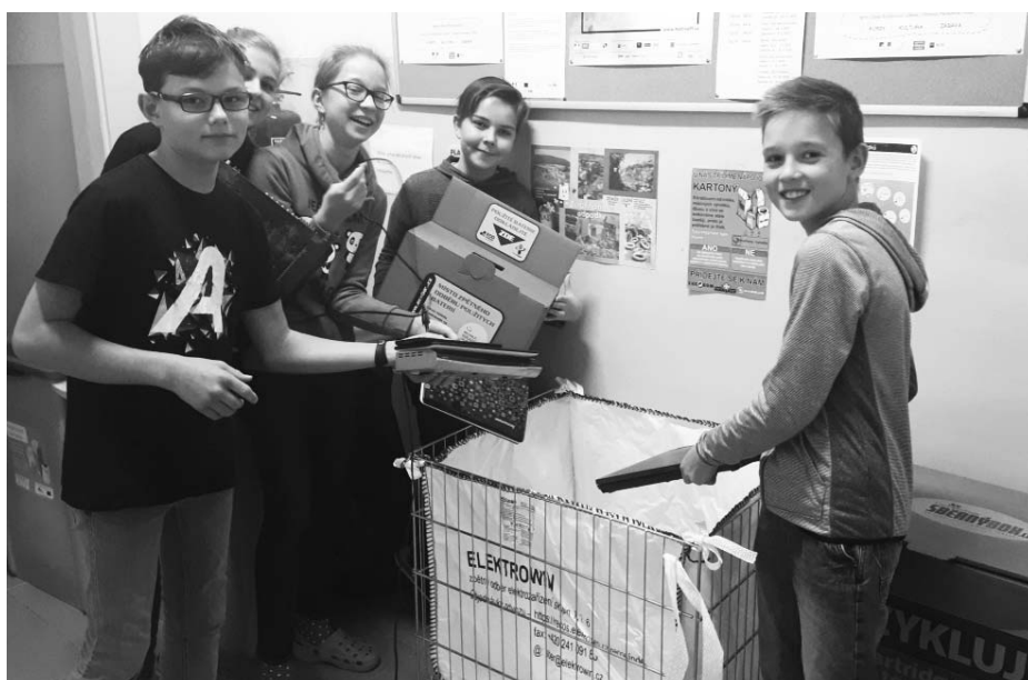
Studenti se učí třídít baterie a elektrozařízení.