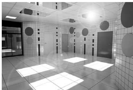
Návrh nového interiéru.

Článek zveřejněn 30. 10. 2018 na webu města.