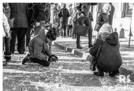
Svatý Martin splnil, co slíbil - na náměstí snežilo.