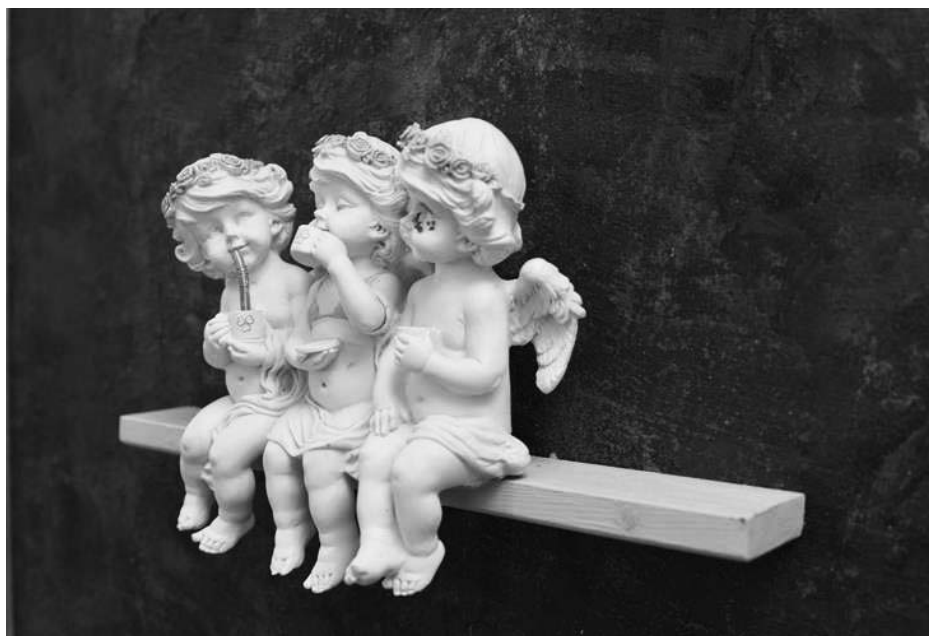
Členové spolku Alfons ukázali opět po roce svoje díla.

Článek zveřejněn 5. 11. 2018 na webu města.