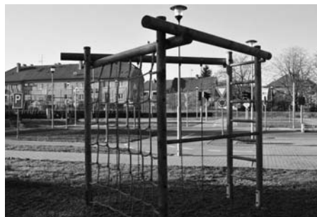
Všechna dětská hřiště prošla rozsáhlou revizí.