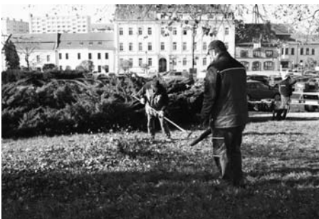
Odklizení napadaného listí se děje téměř neustále.

Článek zveřejněn 16. 11. 2018 na webu města.