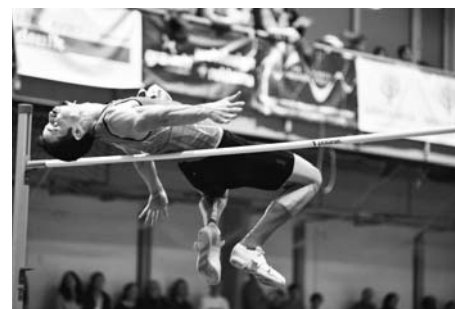
Diváci se mohou těšit, že budou padat rekordy.

zájem přijet i letos. I on má os. rekord 233 cm a v tomto roce vyhrál podruhé Asijské hry a byl šestý na halovém MS. Skvělým osobním rekordem 236 cm se může pochlubit Majd Eddin Chazal ze Sýrie, který by v Hustopečích startoval poprvé. K jeho největším úspěchům patří bronz z MS 2017 a 7. místo z OH 2016. Z Asijských her má sbírku tří stříbrných a dvou bronzových medailí.