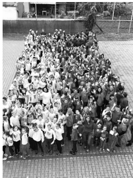
Živou státní vlajku tvořilo více než 300 žáků.