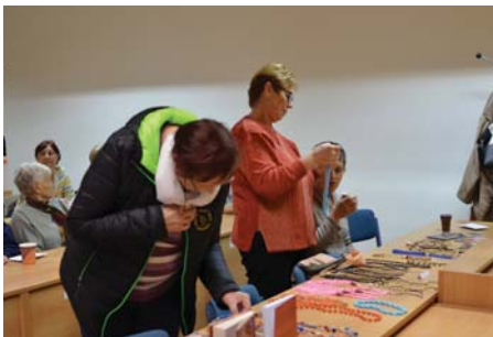
Návštěvníci si mohli koupit šperky vyrobené Afričany.

Proti podobnému obchodu se snaží bojovat Světová zdravotnická organizace nebo ústavy pro kontrolu léčiv. „Ale je to velmi těžké, protože v Africe je velká korupce a každý je tam podplatitelný. Toto je navíc mnohem větší byznys než třeba obchod s drogami,“ uvedla Hindráková.