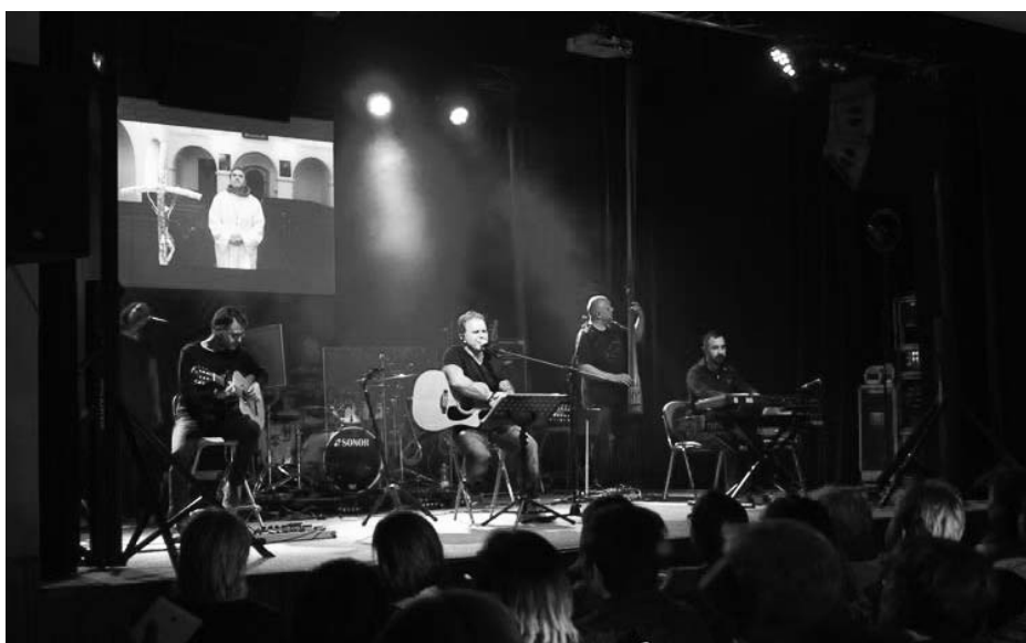
Smolík předvedl zábavnou podívanou.

Článek zveřejněn 8. 11. 2018 na webu města