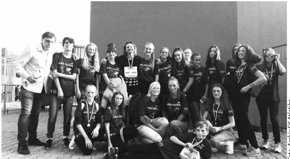
Hustopečští atleti fandili na Kontinentálním poháru v Ostravě družstvu Asie a Pacifiku.

Na Kontinentálním poháru startovali v každé disciplíně dva nejlepší z jednoho kontinentu, takže se zde představila plejáda olympijských vítězů, mistrů světa a světových