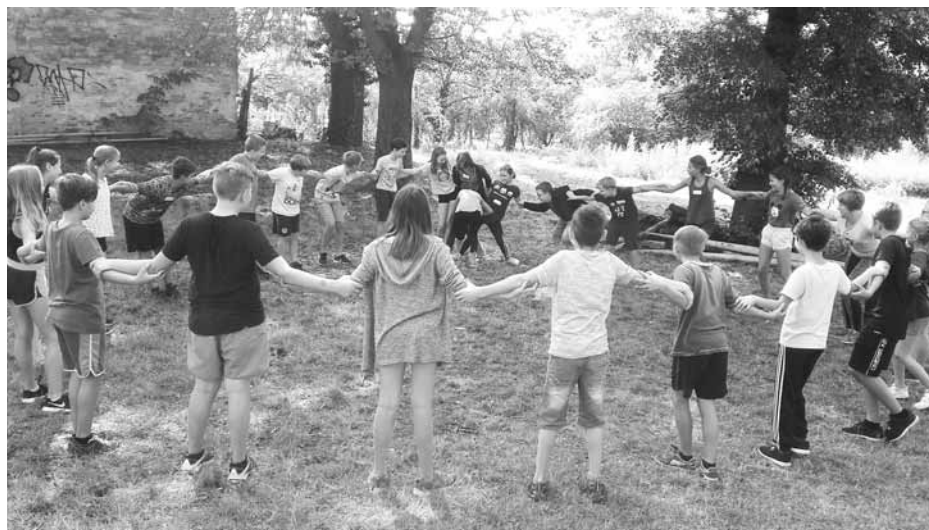
Šestáci pracovali na sounáležitosti třídy.

Během prvního týdne tohoto školního roku se konaly jednodenní adaptační kurzy v našich třech šestých třídách. Místem pro jejich konání nám byly vnitřní, a díky přívětivému počasí i venkovní prostory hustopečského M-klubu. Začátek byl vždy v osm hodin, zakončení pak odpoledne, kolem jedné. V tomto čase bylo nutné stanovit si pravidla hry nejen pro tento den, ale přenést je i do těch dalších. Dopoledne bylo vyplněno aktivitami, které zjišťovaly i podporovaly sounáležitost třídy.