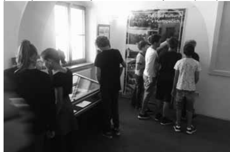
Viděli jsme výstavy věnované 100. výročí republiky.

Sté výročí vzniku republiky připomínají mj. i dvě hustopečské výstavy – v městské knihovně, která se věnuje celé republice, a Hustopeče před sto lety v domě U Synků, jež, jak