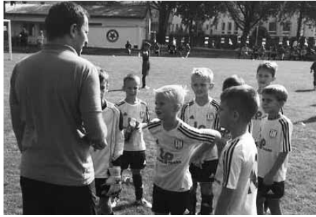
Turnaj hostil desítku týmů.

I když se nehrálo na góly a nepočítaly se body, nešlo přehlédnout, že si hustopečští fotbalisté vedou dobře. „Jsou šikovní, máme z nich radost. Kromě těchto okresních turnajů hrajeme i krajskou soutěž, kde se setkáváme s kvalitními týmy z Brna nebo Znojma a děti to baví. Je to sice trošku náročnější na přípravu, protože míváme tréninky dvakrát až třikrát týdně a o víkendech jezdíme turnaje, ale i tak těch hráčů máme dost,“ vysvětlil Rojka. Záro-