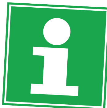
Oblíbené jsou turistické známky.