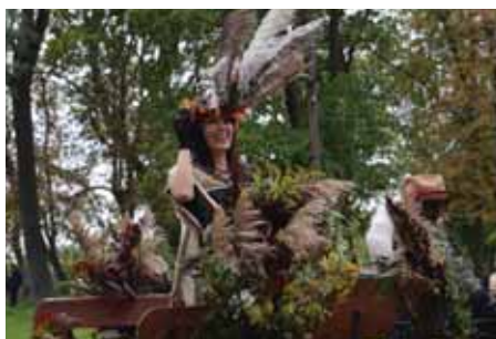
Podzimní královna se ihned ujala vlády.

si mohly opéct špekáček, jablíčko, bramboru a další pochutiny. Letní královna náhradnici bedlivě vyhlížela a svou dosavadní vládu si pochvalovala. „Byla velmi dlouhá a velmi teplá. Myslím si, že si všichni léto úžasně užili, ale sluníčko už je teď unavené.“