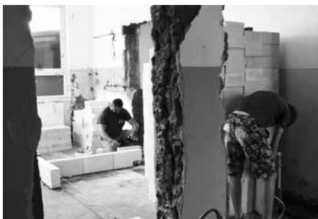
Přestavba by měla být hotová do konce listopadu.

vyhovovalo potřebám praktické i umělecké školy. Stavební úpravy začaly o prázdninách. Týkají se přízemí budovy, kde se musely dílny, sociální zařízení a sklady přesunout do části, která bude patřit k praktické škole. V druhé části budovy určené pro uměleckou školu vznikají taneční sál a výtvarné dílny.