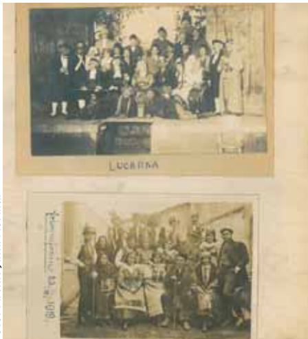
Dobrověrné pohlednice zachycují ochotníky ze souboru Slovač.