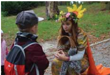
Děti strávily odpoledne s kouzelnými bytostmi.