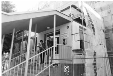
Zateplení Polikliniky se dotklo provozu pouze minimálně.

Práce na zateplení objektu jsou v plném proudu. Termín dokončení je naplánovaný na