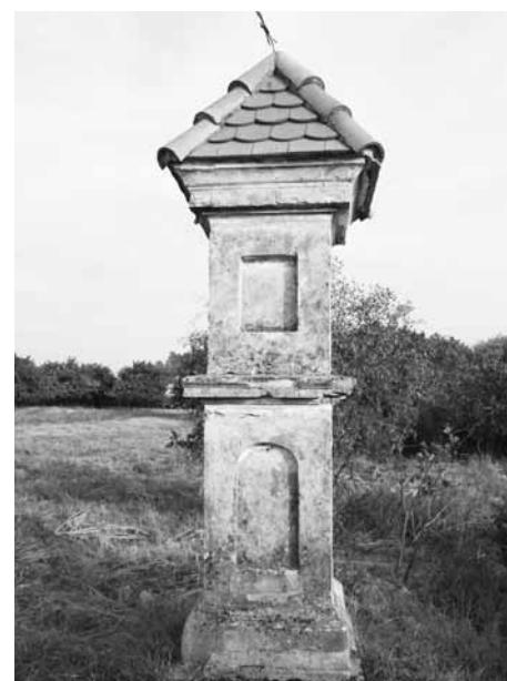
Současný stav Božích muk.

Články byly zveřejněny 29. 8. a 12. 9. 2018 na webu města.