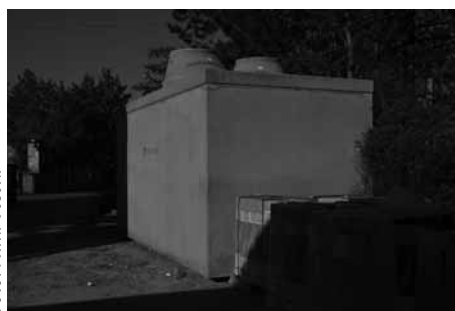
Do nádrže bude sváděna voda ze střechy i ze studny.

Článek byl zveřejněn 26. 9. 2018 na webu města.