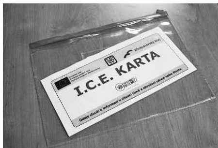
Karta se netradičně uchovává v lednici.