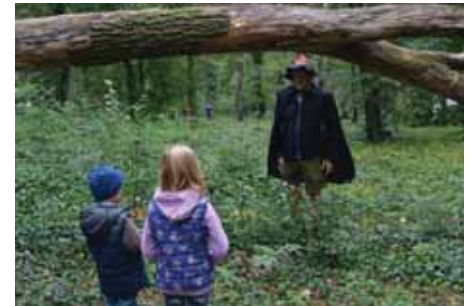
Předváděly hejkalovi, jak dělají zvířátka.

Jezinky, divoženy, skřítky, elfové, kořenovník, vichrnice či hejkal. Kouzelné bytosti si daly v neděli 23. září sraz na Křížovém kopci. Přišly sem pomoci letní královně předat vládu nad počasím a zároveň plnit různé úkoly společně s dětmi.