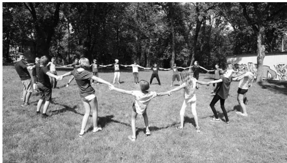
Stmelovací dny si užívali žáci šestých tříd.

Všem zaměstnancům ZŠ Nádražní přejeme spoustu sil, žákům pak mnoho studijních úspěchů a kamarádů. Kolektiv ZŠ Nádražní