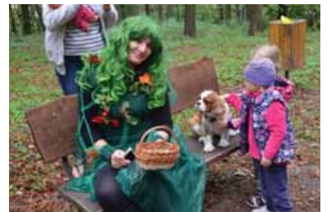
S vichrnici zpěvnou stavěly hnízda ptáčkům.

Děti se cestou seznámily se všemi kouzelnými bytostmi a při čekání na podzimní královnu