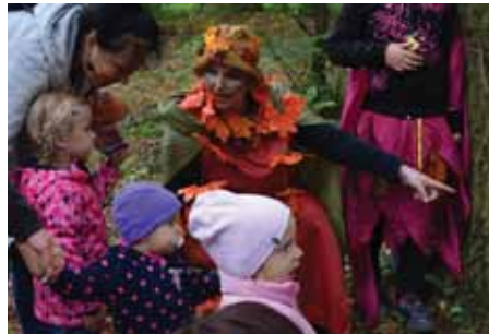
Pomáhaly zachraňovat včelky z pavoučí sítě.