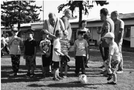
Organizátoři z FC Hustopeče za podpory Fotbalové asociace ČR pro děti připravili různé sportovní disciplíny.

Hustopečský fotbalový stadion se celé páteční dopoledne hemžil dětmi. Ty si přišly