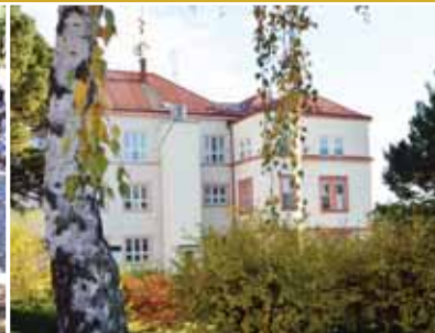
Převod nemocnice pod správu JmK.