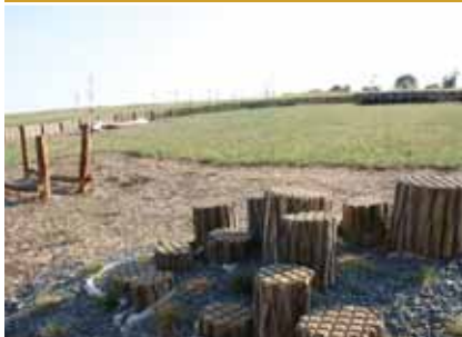
Nová relaxační zóna na Křížovém kopci.