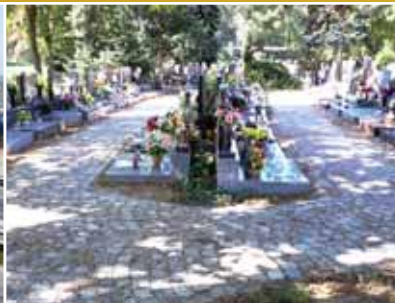
Dlážděné cesty na hřbitově a prodloužený vodovod.