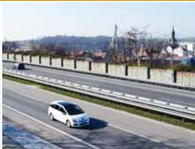
ŘSD přislíbilo rekonstrukci protihlukové stěny.