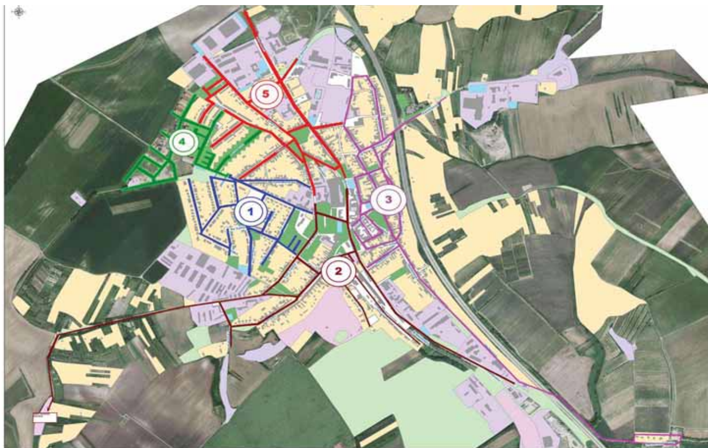
Volební okrsky, seznam ulic a volební místnosti pro volby do zastupitelstev obcí a pro volby do Senátu PS ČR v roce 2018