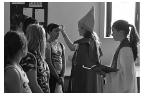
Děti poznávaly svátosti a tvořily.