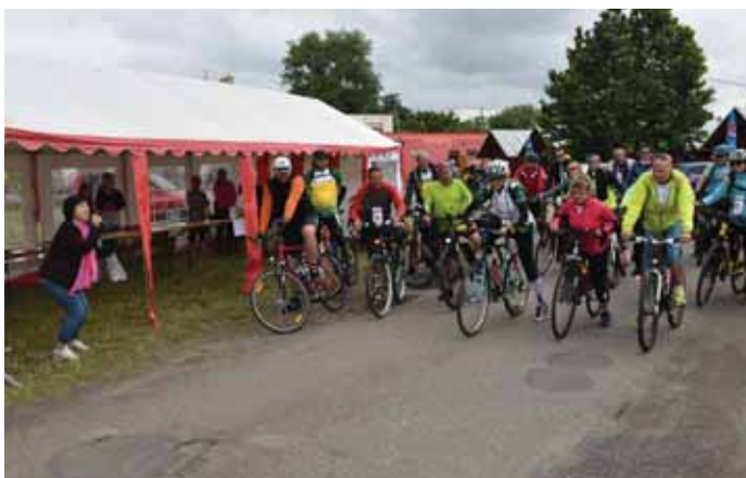
Akci si nenechaly ujít přes tři stovky účastníků.