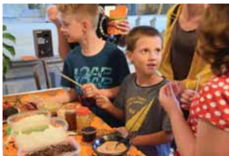
Přednášku o africkém Malawi zpestřila ochutnávka typických jídel.