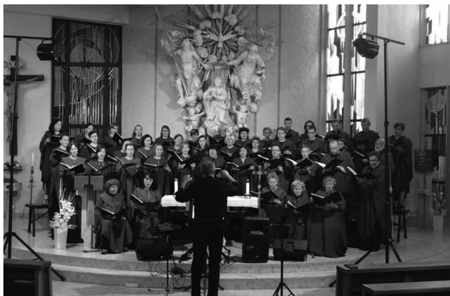
Chrámový sbor funguje už 36 let.

kterém sbor doplní malý orchestr a také na nový repertoár. „V minulosti jsme zabrousili do lehčího žánru a udělali muzikál. Je to dnes celkem módní záležitost, možná se k tomu příští rok vrátíme,“ navrhl Tomek. - ves-