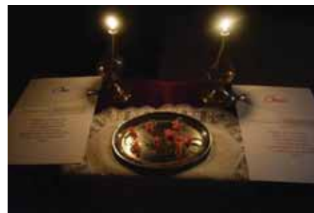
V kapli mohli svůj slib obnovit manželé, na památku jim zůstal květinový prstýnek.