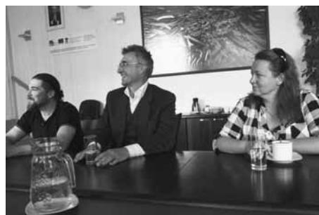
Realizační tým diskutoval o návrzích.