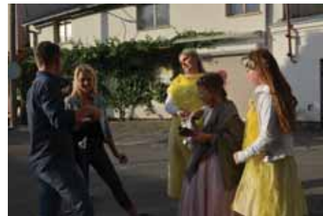
Čarovné bytosti prováděly rituály.

Poražení vinaři z ulice Na Hradbách nesli svou prohru se ctí. „Souboj byl vyvedený. Trochu nám tam chyběla vědomostní soutěž, protože my to máme v hlavě a oni v kilech,“ komentoval prohru Vachala. „Věřím, že za rok se to otočí a my vyhraje,“ dodal. Po souboji se vinaři společně šli u ohně a rituálně spálili přinesené věnce. Obřad zakončili jak jinak, než