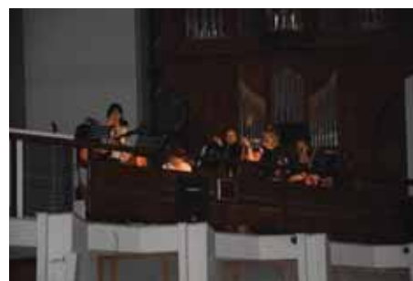
V devět hodin začala adorace doprovázená promítáním modliteb a zpěvy folkové kapely Srdce.