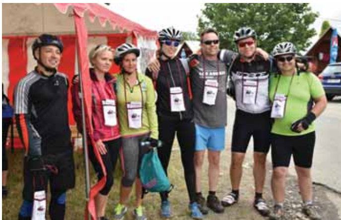
V cíli čekalo na cyklisty hudební odpoledne - Letní notování.