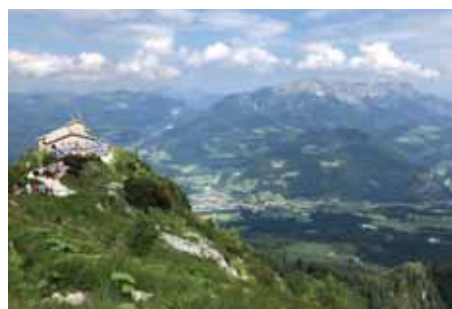
Výhledy do okolí stály za to.