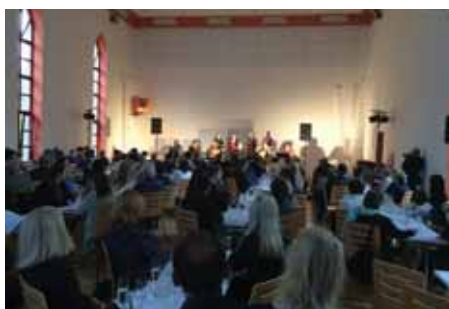
Koncert v Kurdějově byl prokládán degustací vína.