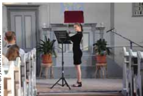
Evangelický kostel hostil absolventy základní umělecké školy.