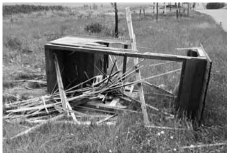
Kadibudka už sloužit nebude.

V noci z 16. na 17. června byl náhle ukončen život kadibudky spolku Všehoschopných. Stála a poskytovala všem blahodárnou úlevu na hranici našeho katastru se spřátelenou obcí Starovice. Milá kadibudka věrně sloužila pocestným, hlavně v období burčáků. Komu vadilo jediné opravdové hnojení v babišových polích? Kdo ji v noci rozštípal doslova na třísky? Umíme pochopit, že někdo v alkoholovém opojení ulomí dveře, ale takto něco zničit, to