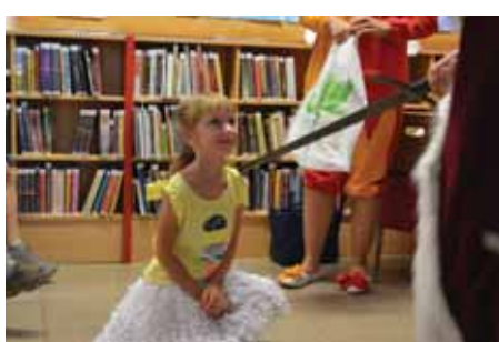
Rytíři slíbili, že se knihy stanou jejich kamarády.