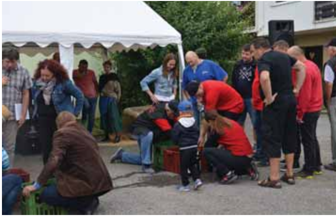
Jednou z disciplín bylo lahvování vína košťýřem.