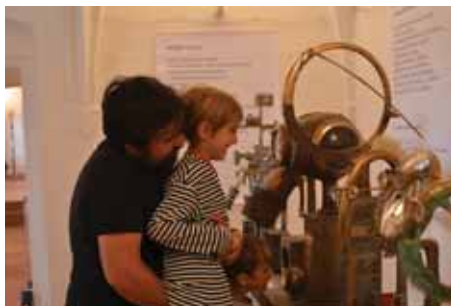
Bronzové sochy zaujaly všechny generace návštěvníků.