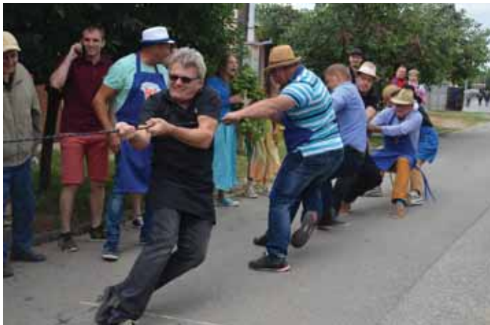
Přetahování nakonec rozhodlo o vítězi.