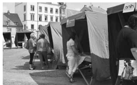
Na náměstí bylo 16 stánků.