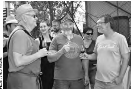
▲ Společný přípitek na dobrou úrodu.

znalosti, důvtip i fyzickou sílu. Během této recese se vzájemně hašteřili. Jejich prvním úkolem bylo také uhodnout byliny z Vína slunovratu. Po společné poradě přišly oba dva týmy pouze na pět bylin. Druhý úkol ukázal jejich zdatnost při práci s košťárem, kdy museli během štafety naplnit demižon vodou. Posledním úkolem byla přetahovaná. Vítězi se