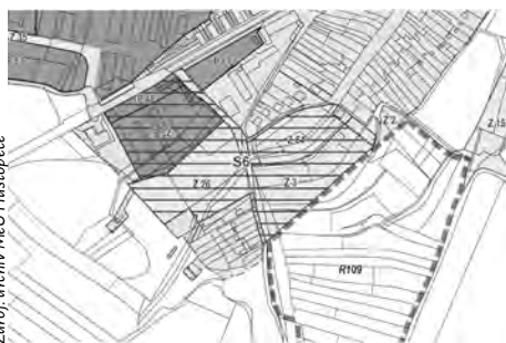
▲ Územní studie bude řešit lokalitu Hustopeče - S6.

Rada města schválila vypracování územní studie pro lokalitu Hustopeče S6 - Homolí vrch, která je důležitá pro další rozhodování v území. Jedná se o pozemky bývalého vepřína a v okolí ulice Habánská. Studie bude stanovovat urbanistické, architektonické a estetické požadavky na využívání a prostorové uspořádání území a jeho změny, zejména pro umístění, uspořádání a řešení staveb. „V této lokalitě se předpokládá i výstavba rodinných domů a další rozvoj v souladu s územním plánem,“ doplnila starostka Hana Potměšilová.