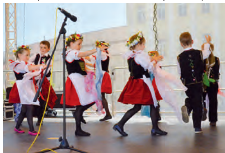
▲ Děti tancovaly.

navázal na dřívější přehlídku dechovek. „Chtěli jsme zachovat lidové a folklórní prvky. Tento ročník jsme zaměřili na děti a pozvali jsme