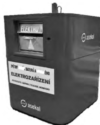
▲ Kontejner na odběr elektrozařízení