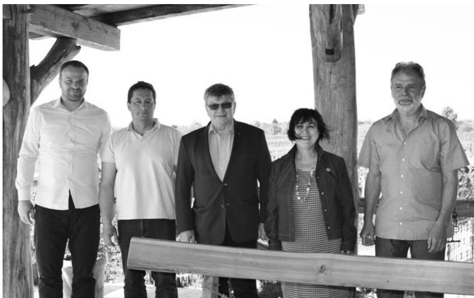
▲ Setkali se zde i zástupci družebních měst.