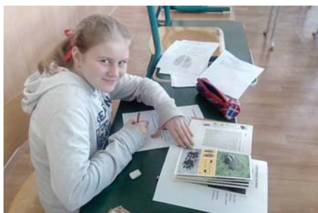
• Naším žákům se daří.