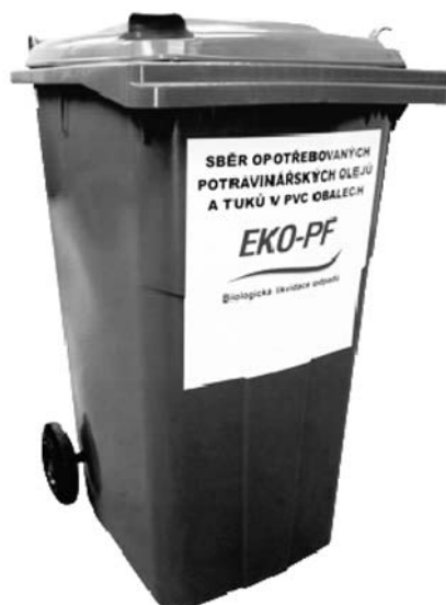
▲ Hustopečská sběrná místa se rozšíří o kontejnery na olej.

Po plánované přestavbě bývalé JIP v roce 2018 v budově nemocnice se odstěhuje z Polikliniky celá rehabilitace a první podzemní podlaží zůstane prázdné. Po zvážení všech pro a proti se od záměru vybudování tří bytů upustilo. Nyní se jedná o nájmu těchto prostor za účelem zřízení odlehčovací péče. Tato služba nabízí seniorům denní pobyt s programem a je určená pro ty, kteří již nemohou zůstat doma bez pomoci a podle sdělení sociálního odboru je u nás velmi potřebná a žádaná. -ves-