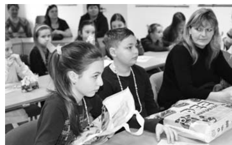
Lovci perel z knihovny.