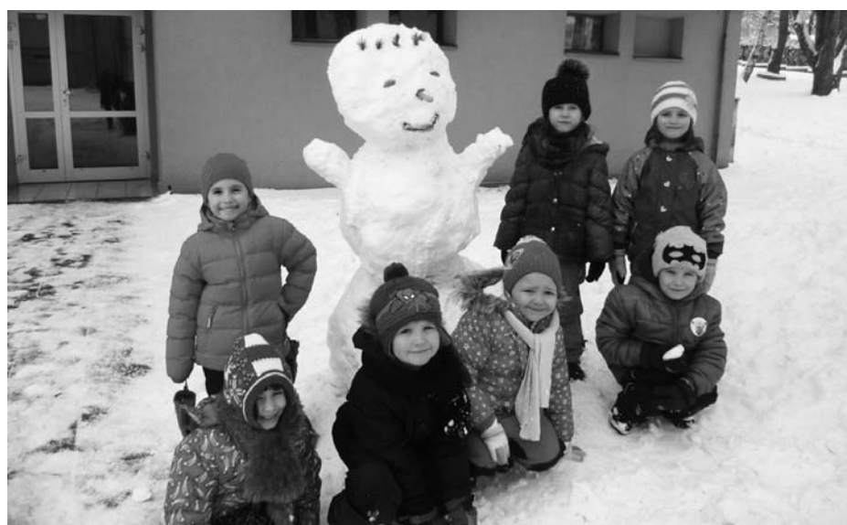
Děti postavily spoustu sněhuláků.