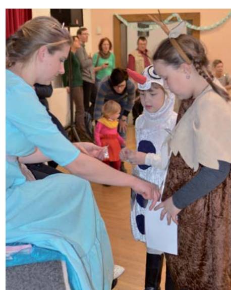
I organizátoři měli tématické kostýmy.