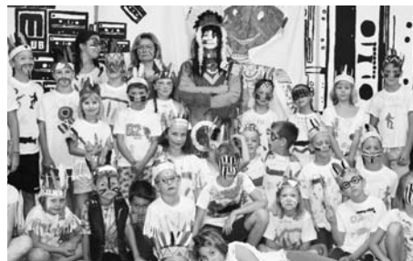
Příměstský tábor Indiánské léto, 2016.