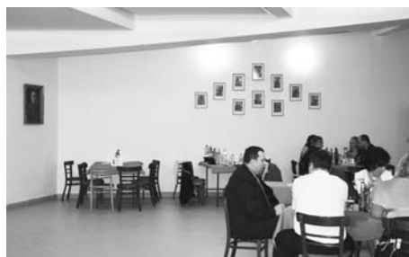
Prostor pro setkávání lidí.