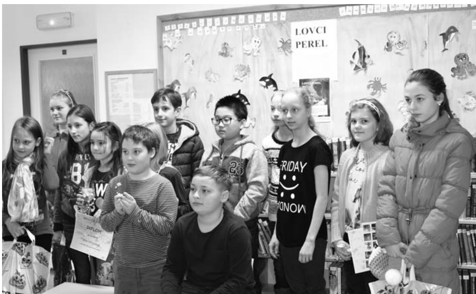
Lovci perel z knihovny.