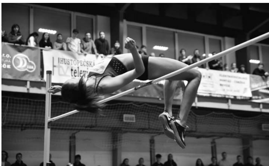
Zlatou medaili získala Morgan Lake za výšku 192 cm.

Laťka ve výšce 226 cm začala být pro výškaře kritická, protože se pohybuje kolem čísla osobních rekordů většiny závodníků. Za atmosféry upřímného fandění, kdy většina publika stála a tleskala, ji ale na třetí pokus zvládlo pět výškařů. 228 cm, vyrovnaný