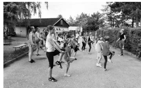
Příměstský tábor Hejbní kostrou, 2016.