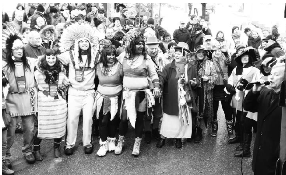
Do masopustního průvodu se zapojilo téměř 100 masek.