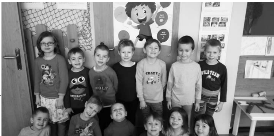
Děti se zapojily do projektu s názvem Příběhy malého Šikuly.