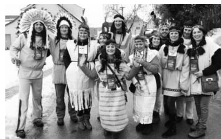
Mohli jste se potkat i s indiány.