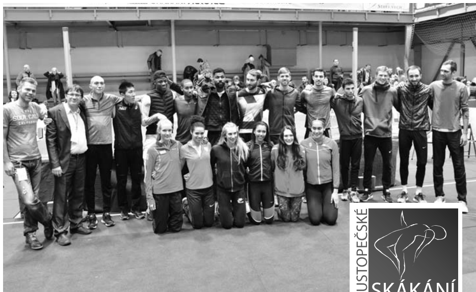
Závěrečné fotografování atletů.

Slavnostní úvod byl zakončen představením