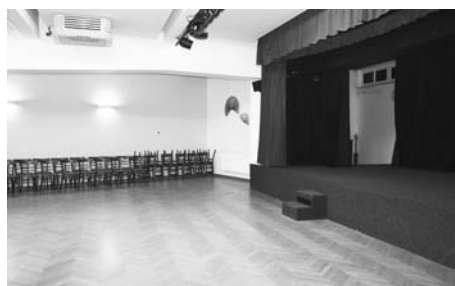
Divadelní sál v novém.