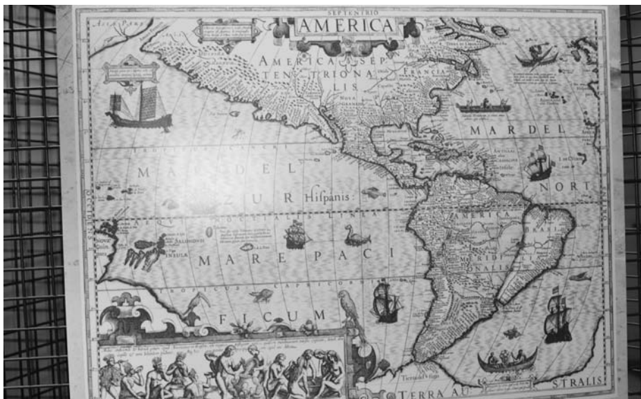
Mapa Ameriky z roku 1606.