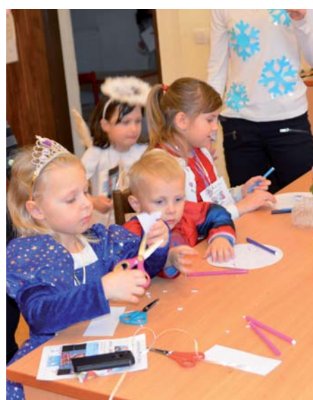
Děti na stanovištích plnily lehké úkoly.