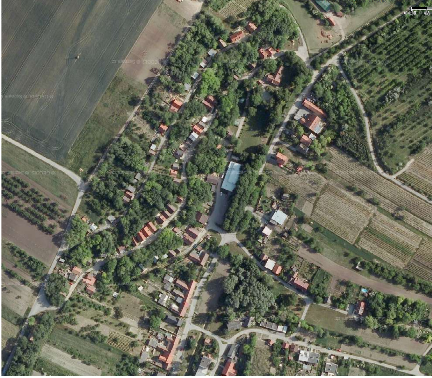
ŘEŠENÁ LOKALITA – UMIŠTĚNÍ V OBCI