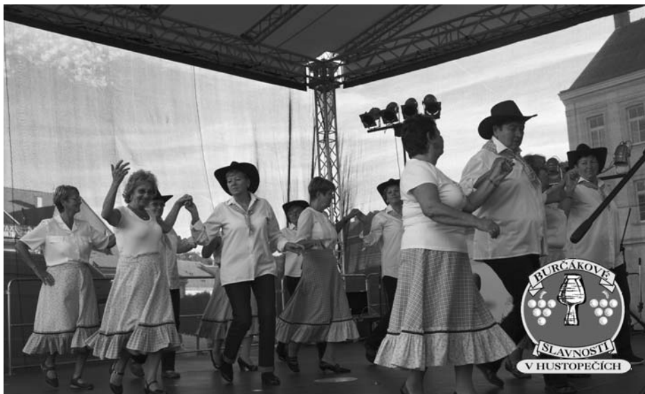
Tančily nejen děti, ale i senioři z Tančírny Na Stará kolena.

Oficiální zahájení Burčákových slavností se však konalo až v pátek 30. září v pět hodin odpoledne. A jako prvním patřilo pódium místním mladým hercům. Soubor Dlaně vystoupil s hrou O cechu trpělivých panen. „Je to pověst o tom, jak vznikla paličkovaná