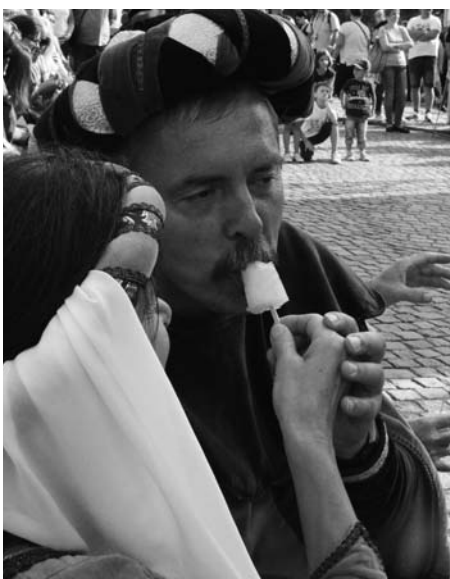
Největší překvapení - Burčákové nanuky.

A organizátoři nezapomněli ani na ty nejmenší. Děti se mohly pobavit pod šapitě pod starou poštou, kde na ně čekala divadelní představení, malování na obličej, historický kolotoč, hry a soutěže.