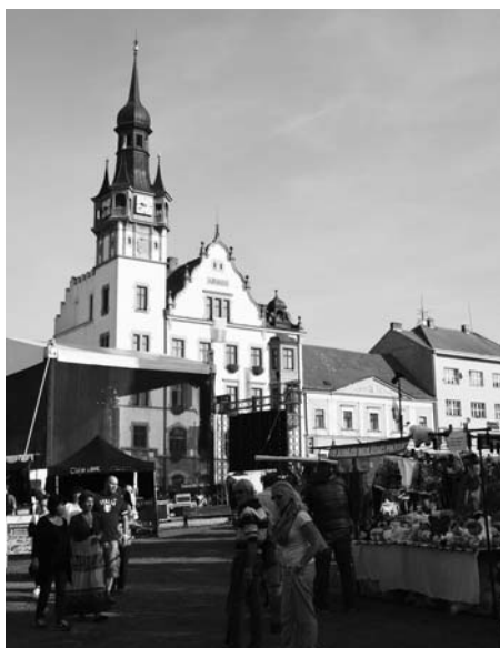
Sobotu zahájil středověký jarmark.

„Ochutnali jsme skoro všechny vzorky burčáku několikrát dokola a chutná nám moc. Jsme tady poprvé a je to úžasný zážitek.