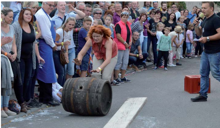
Válení beček na čas se letos zúčastnil rekordní počet žen.

A ani letos nechyběla soutěž ve válení beček v ulici Na Hradbách. Její třetí ročník se mohl chlubit rekordní účastí žen.