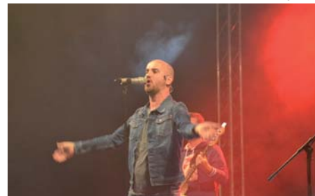
Hvězdou slavností byla kapela No Name.

Už nyní se těšíme na příští ročník Burčákových slavností. Výše číši! -jal-