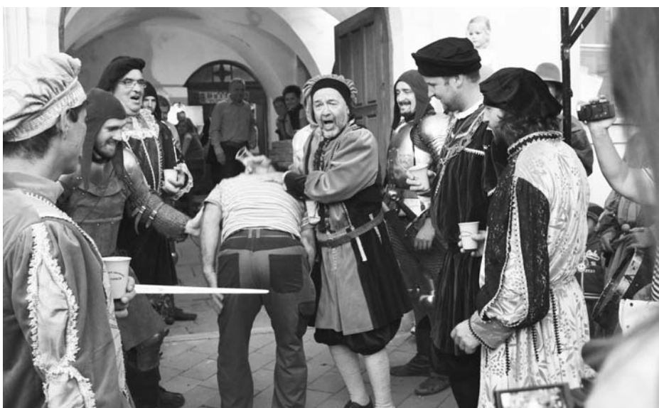
Glejt nalévat burčák dostali všichni mázhausníci. Trestům však neunikli.

A kdo si chtěl chvilky s kalíškem burčáku v ruce užít spíše v komornější atmosféře, zamířil na nádvoří domu U Synků. Na malé scéně tam vystupovala swingová kapela a své produkty tam nabízeli regionální vinaři.