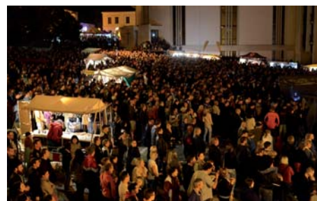
Vrchol slavností si nenechaly ujít tisíce lidí.