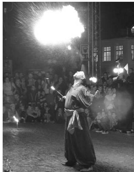
Nechyběla ohňová show.