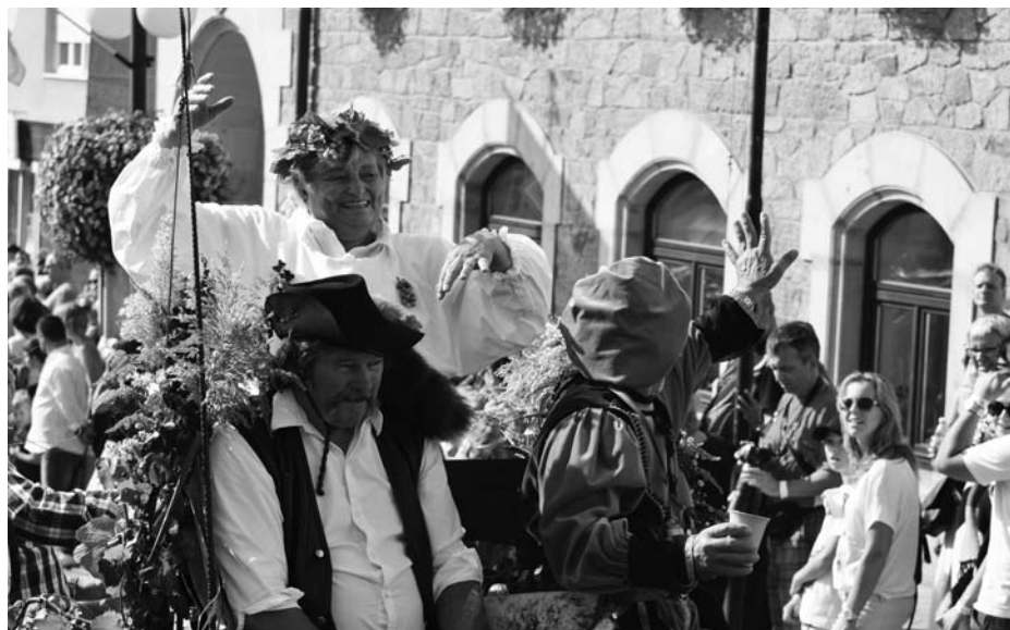
V průvodu nechyběla Kvasinka vinná.

Před početné obecenstvo předstoupilo i Podzemní vojsko, které předvedlo svůj tanec na zastrašení nepřítele. A překvapením byl příchod 1. Burčákové polární výpravy, jejíž členové rozdávali burčákové nanuky.