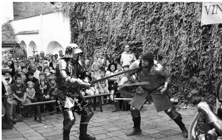
Rytířská klání mohli návštěvníci zhlédnout na nádvoří domu U Synků.

Lákala je i šermířská klání, pohádka nebo klauniáda na Malé scéně na nádvoří domu U Synků. Jejich rodiče tam zase mohli ochutnat vína regionálních vinařů.