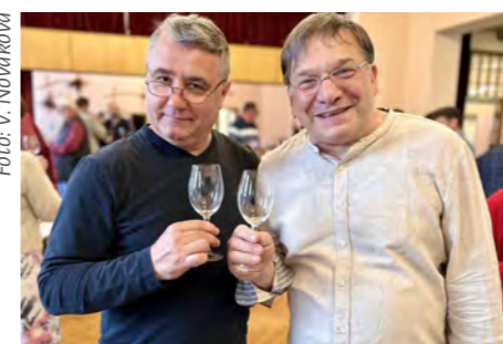
Výstava Hustopečská pečeť se bude konat 4. května.