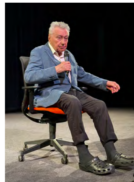
Josef Zíma je i ve vysokém věku stále rád na pódiu.